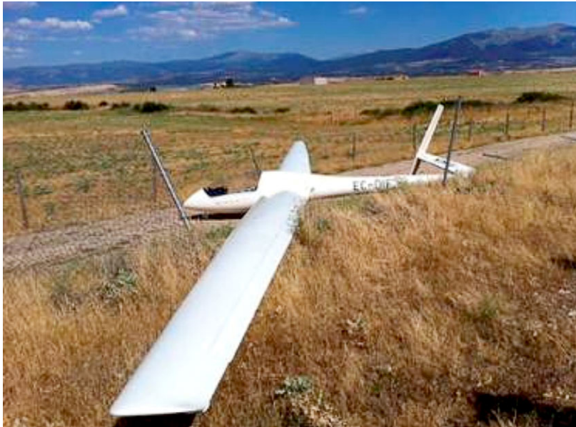
Figura 2. Aeronave detenida tras el accidente