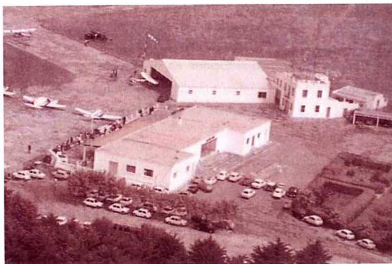
Ilustración 1.1.- Vista aérea del Aeródromo de San Lluís

En septiembre de 1965 se cambia oficialmente la denominación de Aeropuerto de San Lluís por la de Aeropuerto de Mahón. La puesta en servicio de los nuevos DC-4 de la compañía Aviaco obliga a ampliar la pista hasta los 1.850 m, todos ellos asfaltados, que están completados a finales de ese