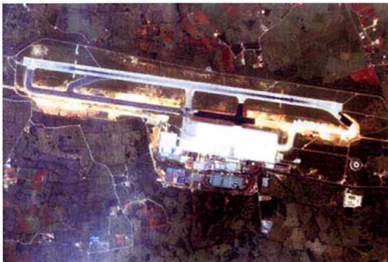
Ilustración 1.2.- Vista aérea del Aeropuerto de Menorca

El viejo Aeropuerto de San Luis se cedió al Real Aeroclub de Mahón – Menorca, fundado en 1968, que ubica en él sus escuelas de Pilotos y Aeromodelismo y se encarga del mantenimiento de sus instalaciones.