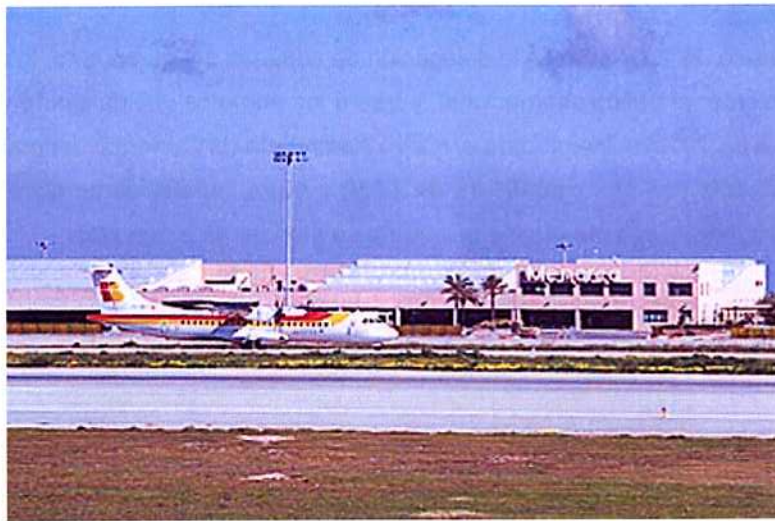
Ilustración 1.3.- Edificio Terminal de Pasajeros

El tráfico aéreo siguió aumentando y en 1994 se alcanzaron los dos millones de pasajeros. La última ampliación del edificio se llevó a cabo ese mismo año y afecta, principalmente, a la zona de salidas internacionales, en la que se eliminaron los preembarques, que desde ese momento pasa a contar con 1.800 metros cuadrados adicionales. También se ampliaron el número de mostradores de facturación y se creó una nueva zona técnica donde se ubica, entre otros servicios, el Centro de Coordinación.