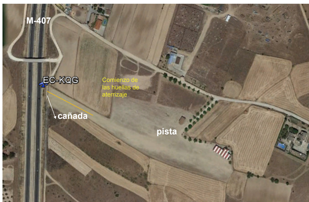
Fotografía 4. Vista aérea del campo de vuelos de Griñón

El campo de vuelos de Griñón (actualmente cerrado) está situado aproximadamente a 25 km al suroeste de la ciudad de Madrid, con coordenadas N 40°13'31" W 3°51'55" y cuya elevación es de 2198 ft. Posee una pista de tierra de orientación 12/30 con una longitud es de 434 m. (véase la Figura 4). La pista utilizada para el aterrizaje el día del accidente fue la 30.