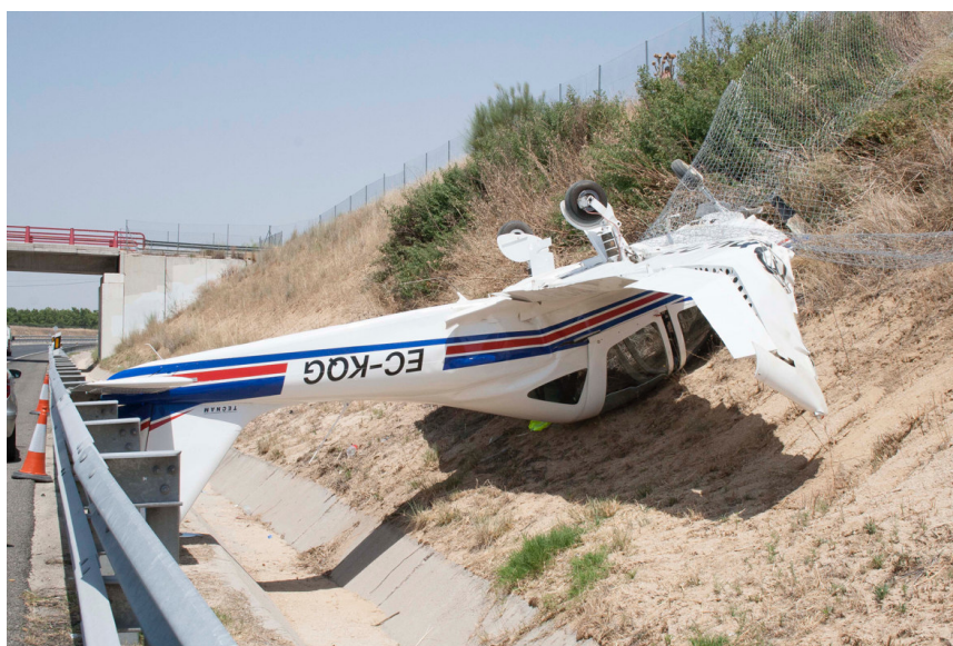
Fotografía 1. Fotografía de la aeronave en su posición final.