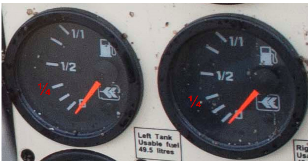
Fotografía 3. Indicadores de combustible en cabina

Los indicadores de combustible (aforadores) en cabina son del tipo que se muestra en la siguiente imagen: