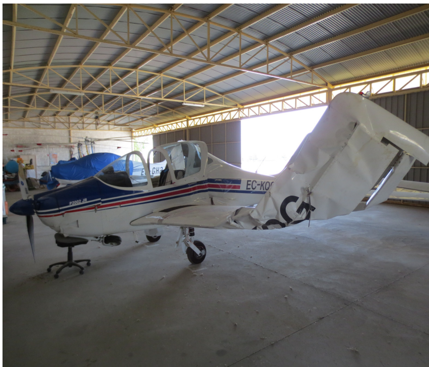
Fotografía 7. Inspección de la aeronave en el hangar

interior de ese plano constatando que el daño no había llegado al tabique de separación entre la zona del depósito y el resto. Las ventilaciones y rebosaderos de las puntas de los planos estaban bien, sin obstrucción.