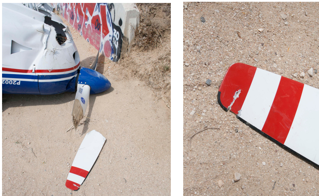
Fotografía 6. Fotografía de la hélice tras el accidente

El equipo investigador se trasladó inmediatamente al lugar del accidente. La aeronave se encontraba volcada en el margen de la carretera delimitada por los guardarrailes, con el empenaje de cola apoyado en éstos. La rueda de morro estaba enganchada con la valla perimetral entre el camino de la cañada y el terraplén anterior a la carretera. La punta de una de las palas de la hélice, también estaba enganchada a la valla mostrando dos muescas y estaba seccionada transversalmente. La otra pala estaba intacta. Los flaps estaban desplegados aproximadamente unos 30° (mitad de recorrido entre posición de flaps de despegue (15°) y flaps de aterrizaje (40°)). El horómetro marcaba una lectura próxima a 44,6.