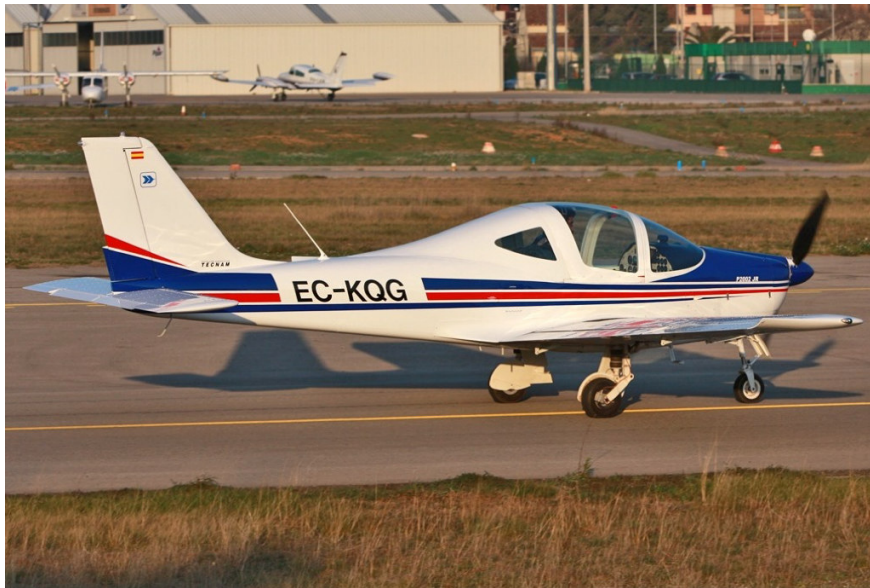
Fotografía 2. Fotografía de la aeronave 6

La aeronave tenía dos depósitos de combustible con capacidad de 49,5 litros utilizables en cada uno. En el motor ROTAX 912 S3 el combustible pasa a la bomba eléctrica que hace de bypass si no está accionada y de ahí a la bomba mecánica. La bomba mecánica nutre a los dos carburadores. Como particularidad el sobrante de combustible en esta aeronave va al depósito izquierdo.