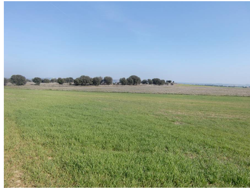
VISTA SENTIDO LLEIDA. ENTORNO DEL PK 8+700. VISTA DESDE MARGEN DERECHA DE LA FUTURA AUTOVÍA.