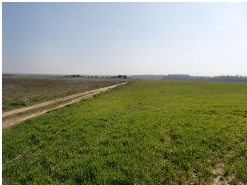
CAMINO DE LASCASAS. ENTORNO DEL CRUCE CON LA VARIANTE. REPOSICIÓN CON PASO INFERIOR.