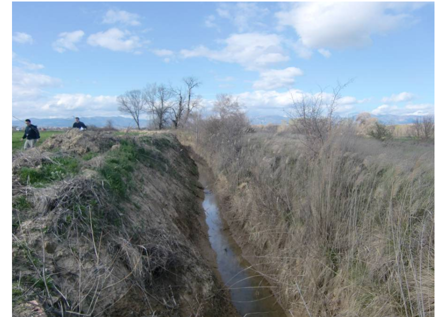
VISTA DE LA ACEQUIA MADRE, DESDE EL PASO EXISTENTE PARA SU CRUCE.