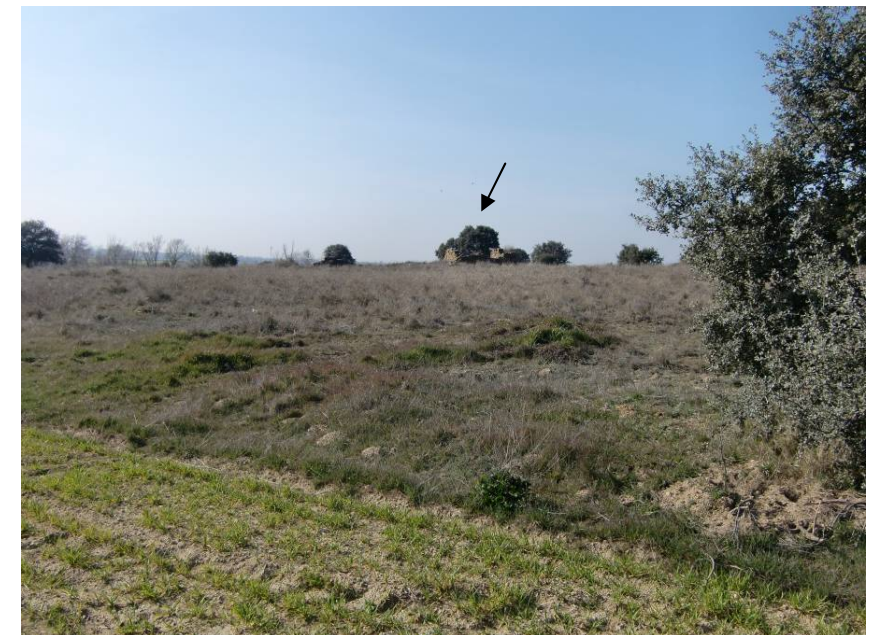
VISTA RUINAS SITUADAS EN MARGEN DERECHA A LA ALTURA DEL PK 8+460 (SIN AFECCIÓN).