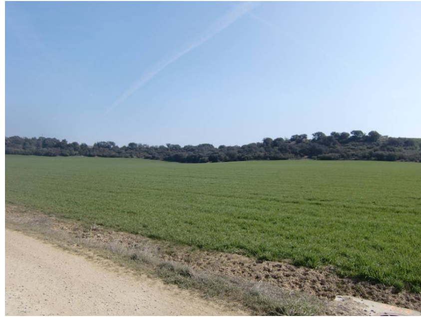
VISTA ZONA PASO DE LA VARIANTE. TRAMO ENTRE PPKK 3+000 A 3+200. DESDE MARGEN DERECHA