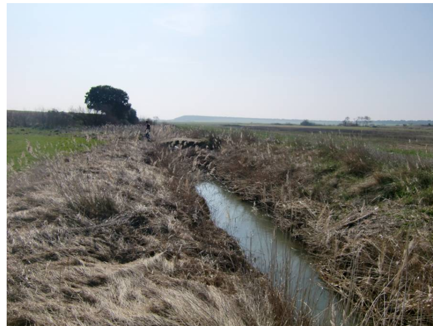
BARRANCO DE VALDABRA. VISTA HACIA AGUAS ABAJO