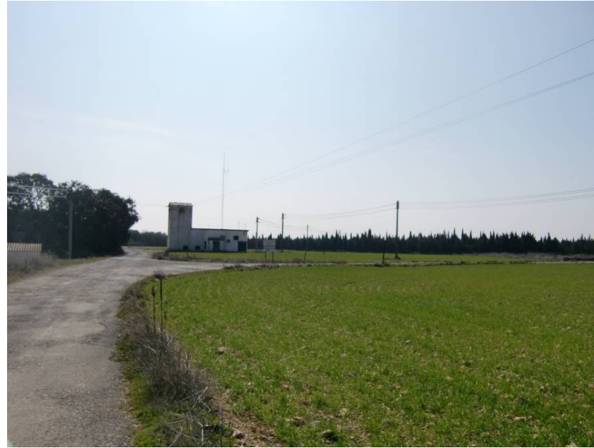
CAMINO DE ACCESO A LAS GRANJAS. REPUESTO UNOS METROS MÁS ADELANTE CON UN P. S.