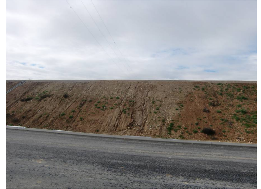
TERRAPLÉN EN EL QUE HABRÁ DE EJECUTARSE EL P. I – 0 67 BAJO LA A – 22. VISTA DESDE MARGEN IZQUIERDA DE LA AUTOVÍA (SENTIDO ZARAGOZA)