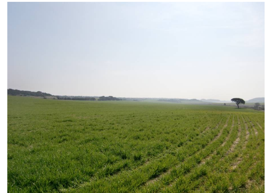
VISTA TRAMO ENTRE PPKK 1+500 – 2+ 200. MARGEN DERECHA