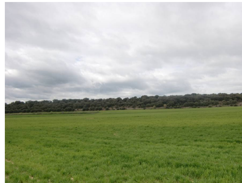
VISTA SENTIDO ZARAGOZA. ENTORNO DEL PK 16+760