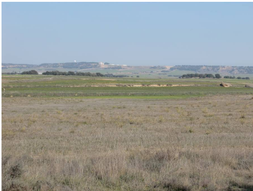
VISTA ZONA DE PASO. ENTORNO DE LOS PPKK 10+400 A 10+800. VISTA DESDE MARGEN IZQUIERDA EN SENTIDO LLEIDA.