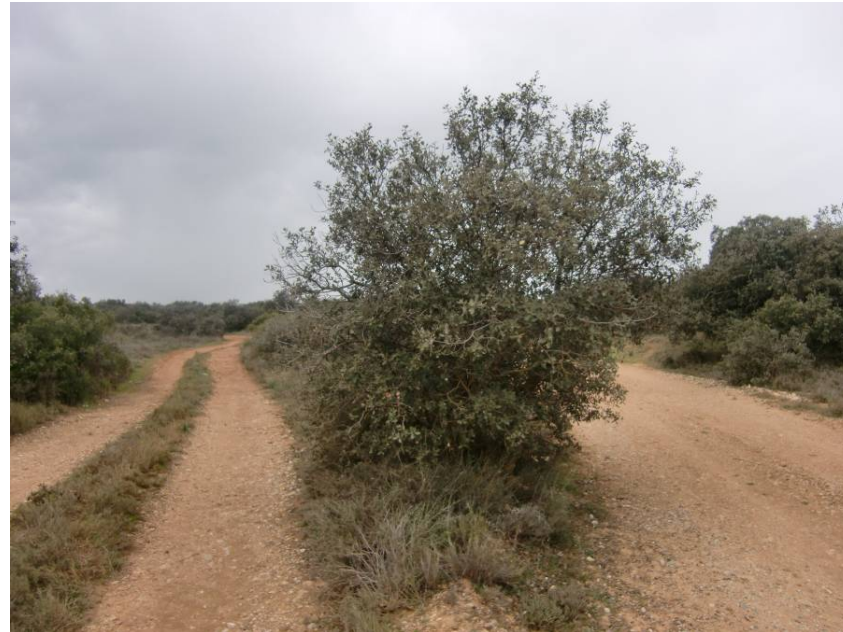
CABAÑERA REAL. QUEDA REPUESTA A TRAVÉS DE UN PARO SUPERIOR.