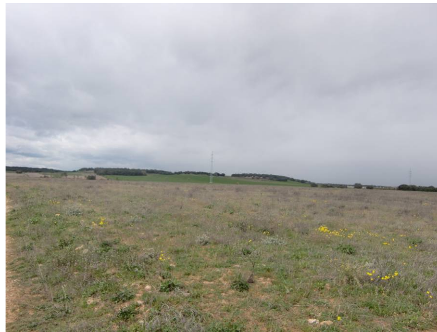
VISTA ZONA DE PASO DE LA VARIANTE. ENTORNO DE LOS PPKKS 15+ 600 A 15+800. VISTA DESDE EL MARGEN DERECHA EN SENTIDO LLEIDA.