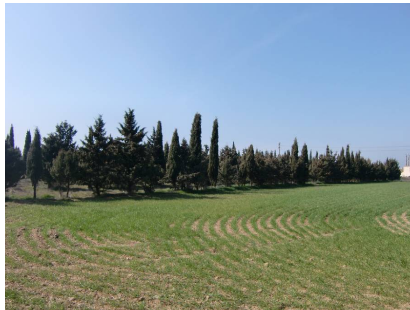
VISTA ZONA DE PASO DE LA VARIANTE. TRAMO COMPRENDIDO ENTRE LOS PPKK 3+400 Y 3+500. AFECCIÓN A PLANTACIÓN DE CONÍFERAS