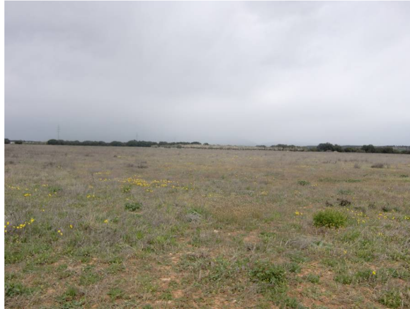
VISTA ZONA DE PASO DE LA VARIANTE. ENTORNO DE LOS PPKKS 15+600 A 15+700. VISTA DESDE MARGEN DERECHA EN SENTIDO LLEIDA.