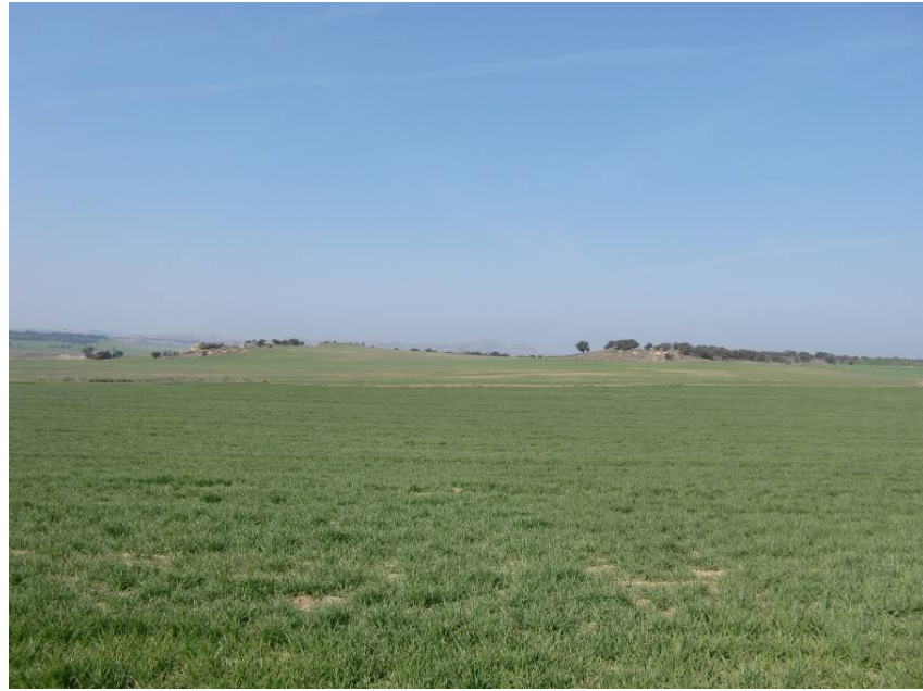
VISTA SENTIDO ZARAGOZA DESDE PK 2+960