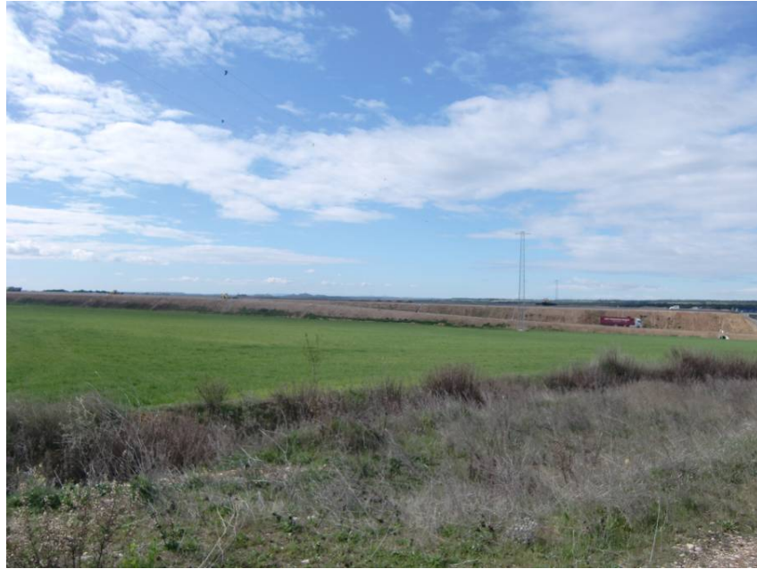
VISTA DESDE MARGEN IZQUIERDA DE LA AUTOVÍA A – 22. EN CONSTRUCCIÓN. ZONA CORRESPONDIENTE AL RAMAL LLEIDA – GLORIETA A – 22 (EJE 101) DEL ENLACE DE SIÉTAMO.