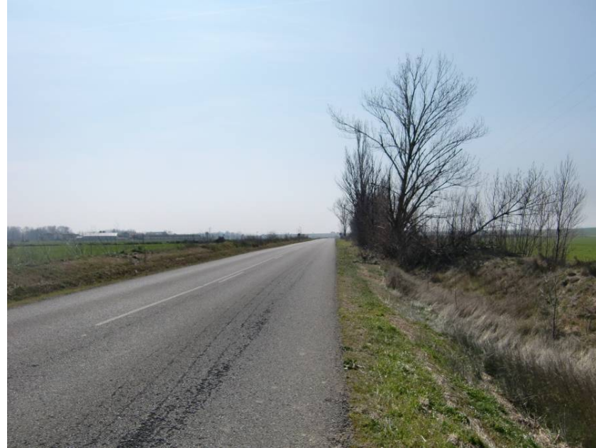
VISTA DE LA CARRETERA A-212. A PESAR DEL TRAZADO RECTO EN PLANTA SE APRECIAN DEFICIENCIAS EN SU VISIBILIDAD QUE RECOMIENDA SU REPOSICIÓN MEDIANTE UN PASO SUPERIOR.