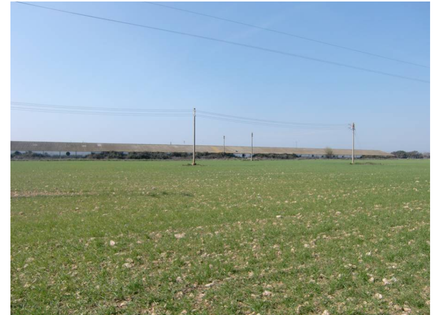
GRANJAS AFECTADAS POR EL TRAZADO DE LA VARIANTE