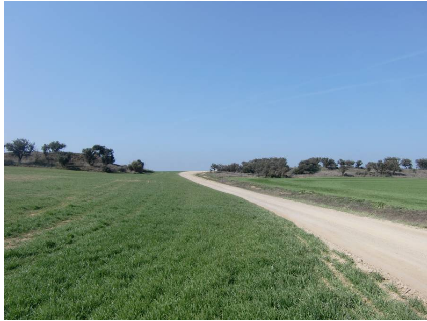
CAMINO DE S JUAN ALTO. VISTA ZONA DE PASO DE LA VARIANTE. TRAMO PK 2+ 400 – 2+600. MARGEN IZQUIERDO