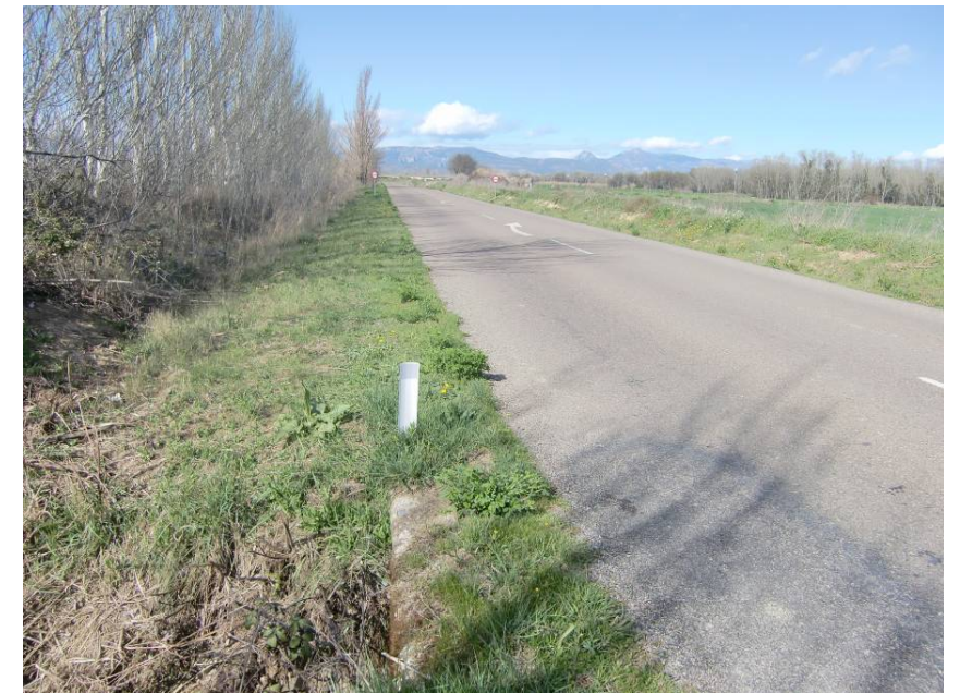
VISTA CARRETERA A-1212 SENTIDO HUESCA