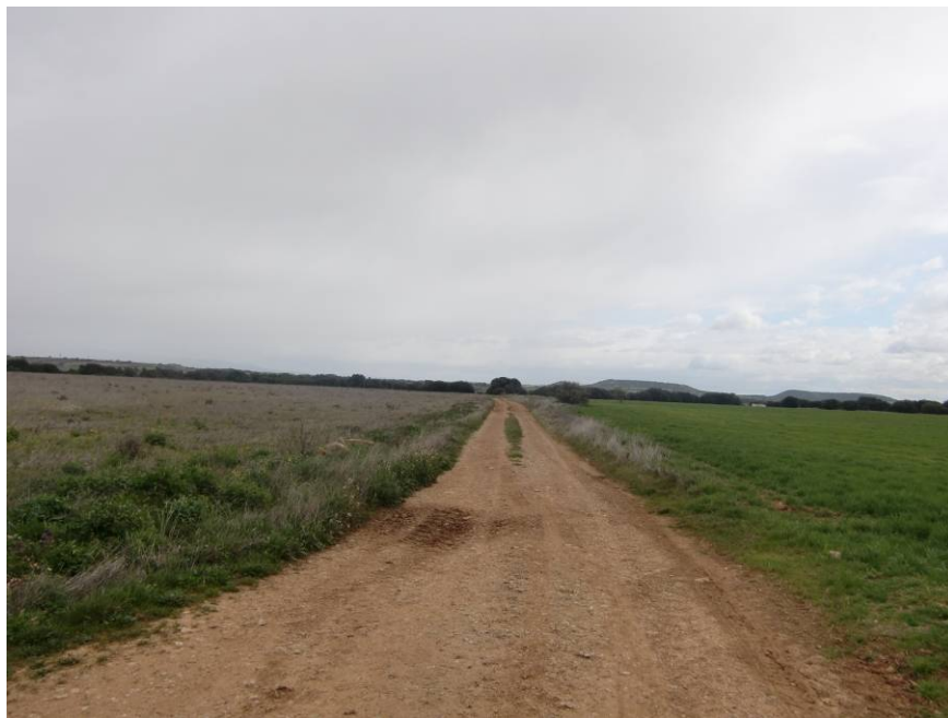
VEREDA DE OLA. REPOSICIÓN MEDIANTE PASO SUPERIOR.