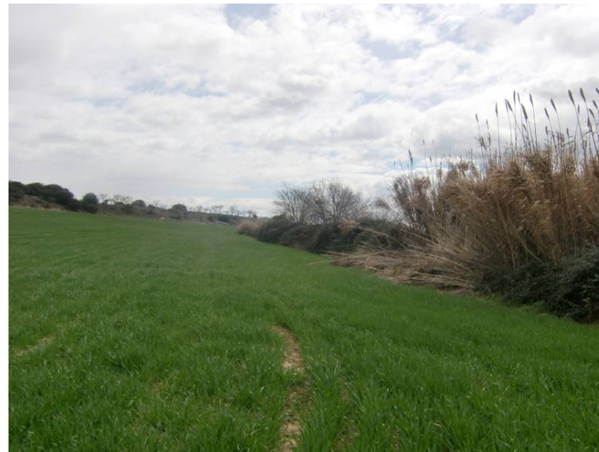
ZONA DE PASO DE LA VARIANTE. ENTORNO DE LOS PPKS 16+160 A 16+200