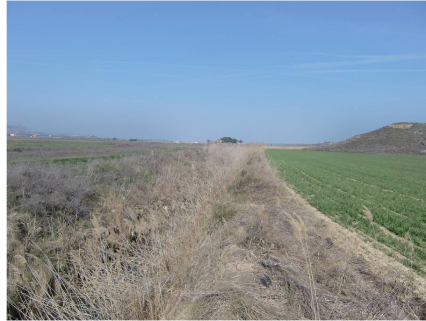
BARRANCO DE VALDABRA. VISTA AGUAS ARRIBA