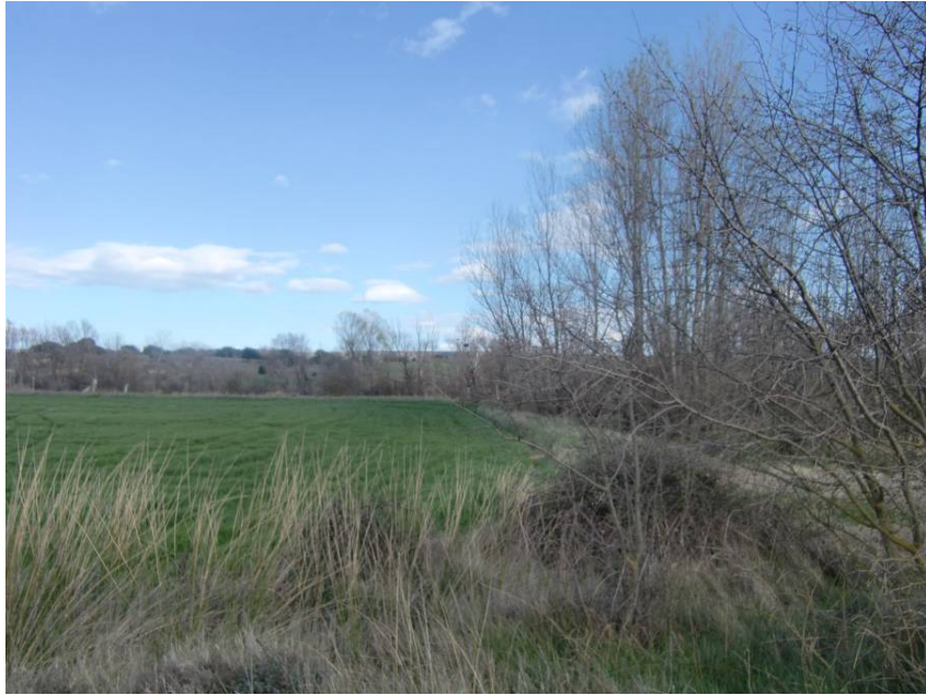
VISTA BOSQUETE (A LA DERECHA DE LA IMAGEN) CUYA NO AFECCIÓN ES INDICADA EN LA D. I. A.