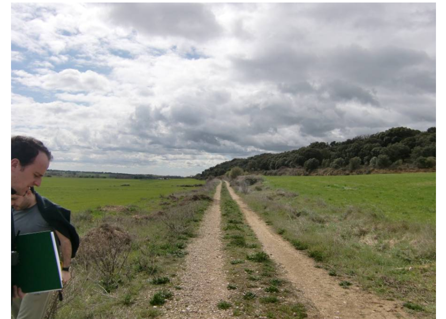
CAMINO DE LA RAMBLA. VISTA HACIA EL SUR DE LA ZONA EN LA QUE SE PRODUCE EL CRUCE DE LA VARIANTE