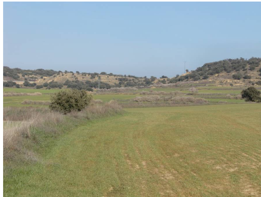
VISTA ZONA DE PASO DE LA VARIANTE. ENTORNO DE LOS PPKKS 12+900 A 13+100. VISTA DESDE MARGEN IZQUIERDA EN SENTIDO LLEIDA.