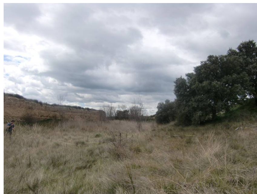
CAUCE DEL RÍO BOTELLA, VISTA HACIA AGUAS ABAJO.