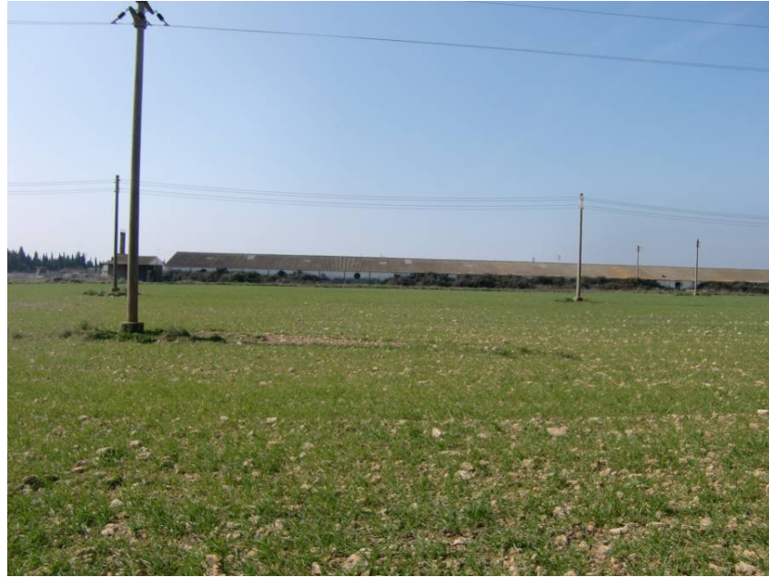
VISTA DE LAS GRANJAS AFECTADAS POR EL TRAZADO DE LA VARIANTE