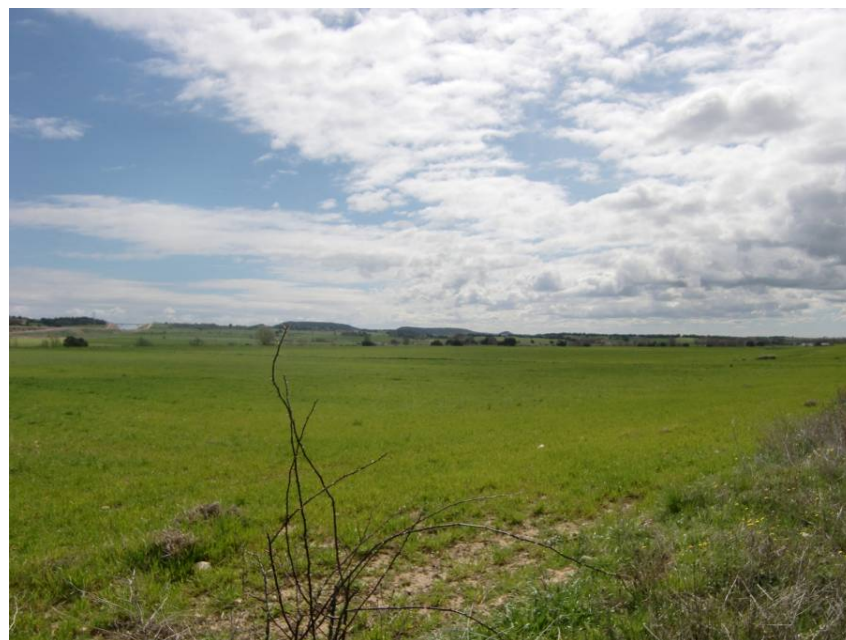
VISTA ZONA DE CONEXIÓN CON LA AUTOVÍA A - 22. ENLACE DE SIÉTAMO