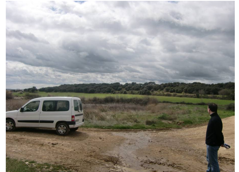
VISTA ZONA DEPRIMIDA CON ACUMULACIÓN DE AGUA. EL PROYECTO CONTEMPLA EL RELLENO DE ESTA ZONA Y LA REPOSICIÓN DE LA Balsa.