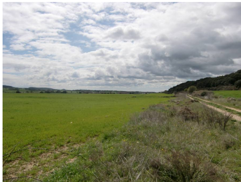
ZONA DE PASO DE LA VARIANTE. ENTORNO DE LOS PPKS 16+ 500 A 16+650. VISTA DESDE MARGEN IZQUIERDA.