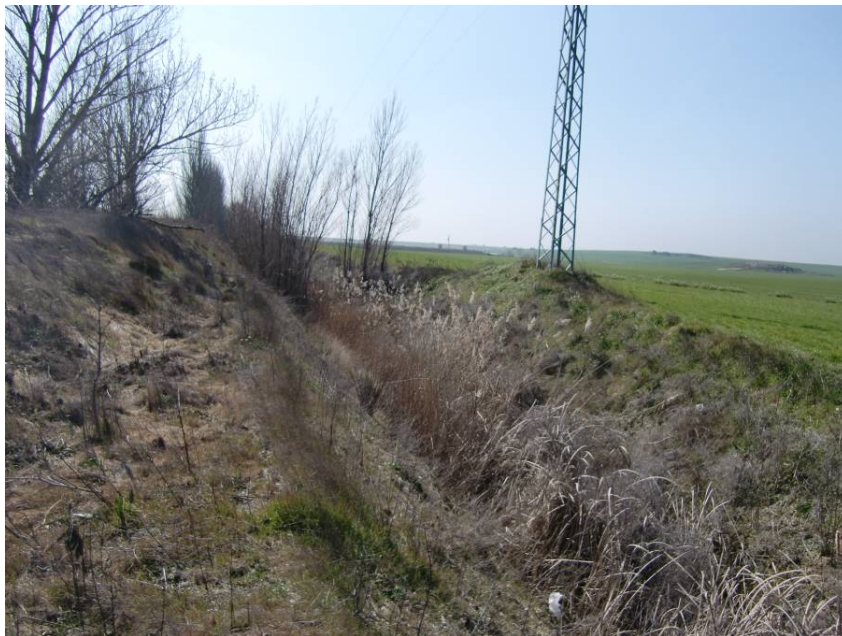
VISTA ACEQUIA PARALELA A LA CARRETERA A - 1212.