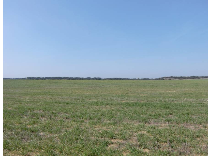
VISTA HACIA ZARAGOZA DESDE ENTORNO DEL PK 4+260