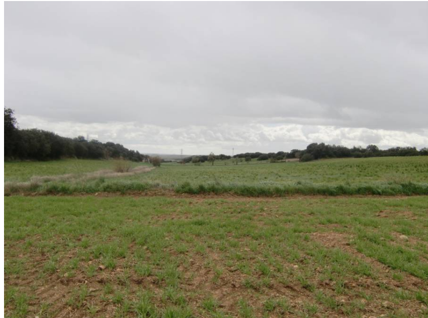
VISTA CUENCA COLGADA EN EL ENTORNO DE PK 13+600