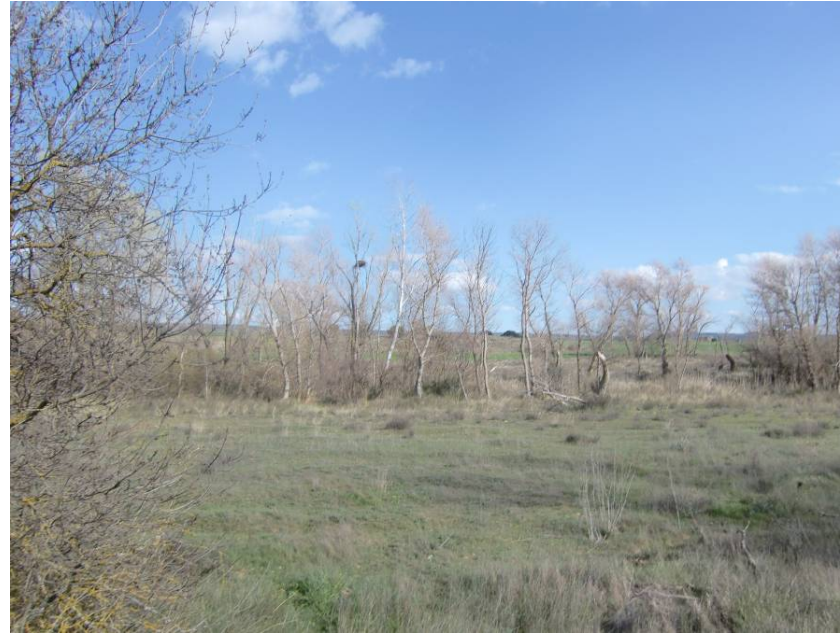
VISTA SENTIDO LLEIDA. PUNTO DE CRUCE DEL RÍO FLUMEN, EN EL QUE SE HA BUSCADO LA MENOR AFECCIÓN POSIBLE A LA VEGETACIÓN DE RIBERA.