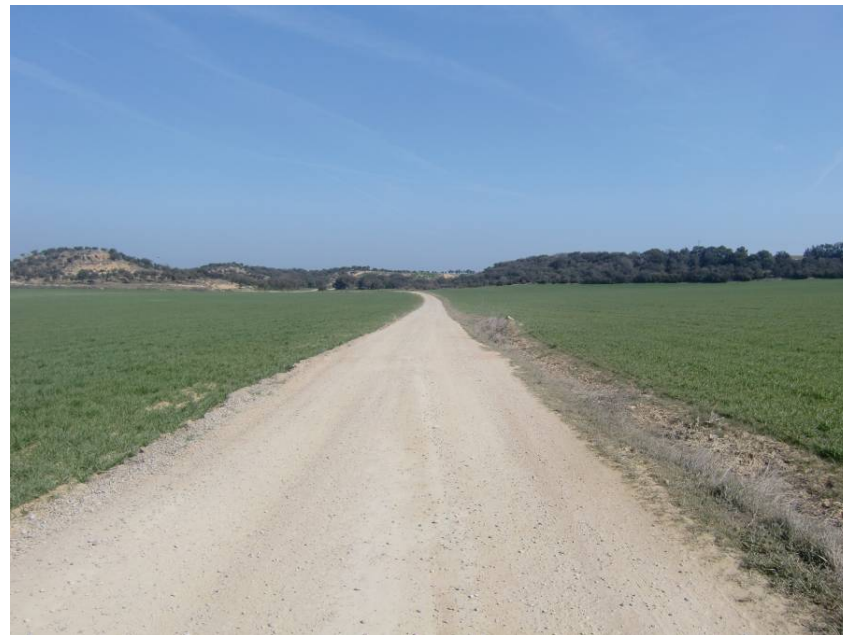
VISTA ZONA DE CRUCE DE LA VARIANTE SOBRE EL CAMINO DEL CARRASCAL