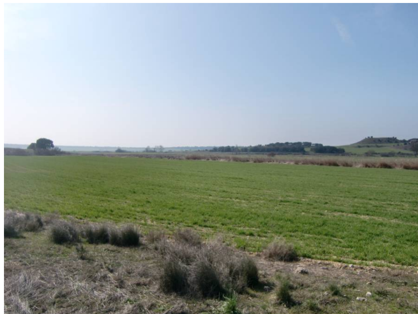
VISTA ZONA CONEXIÓN CON ENLACE DE VALDABRA (MARGEN IZQUIERDA)