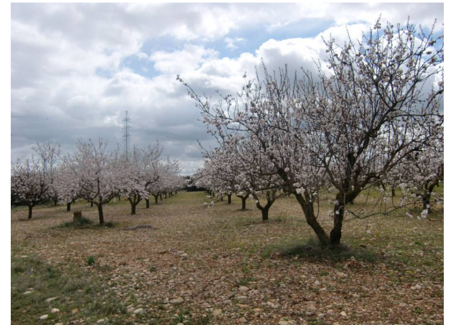
VISTA ZONA DE PASO DE LA VARIANTE. ENTORNO DE LOS PPKS 14+700 A 14+500. VISTA TOMADA DESDE MARGEN IZQUIERDA EN SENTIDO ZARAGOZA