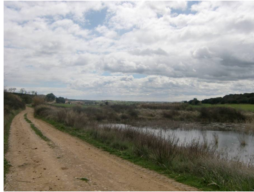
CAMINO A OLA Y BALSA A RELLENAR Y REPONER