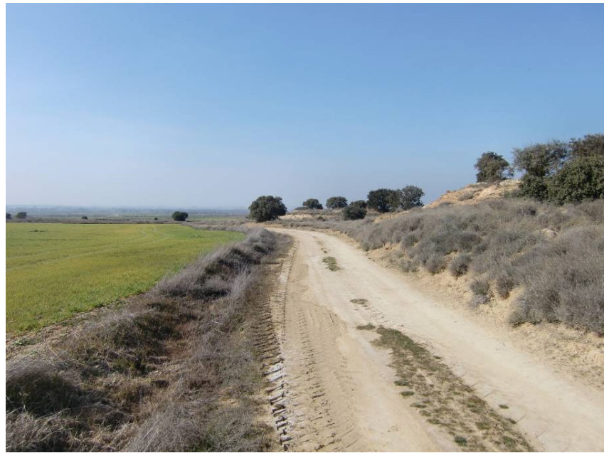
INICIO CAMINO DE LASCASAS. RECORRIDO HACIA EL SUR BUSCADO EL CRUCE DE LA VARIANTE.