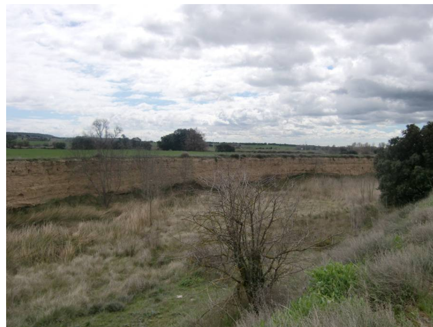
ZONA DEL CRUCE DEL RÍO BOTELLA