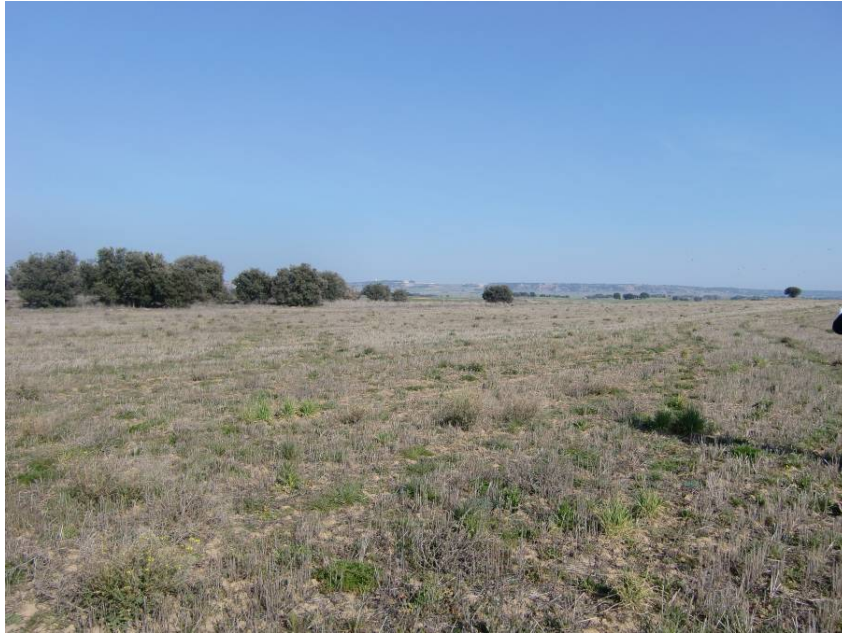
VISTA ZONA DE PASO. ENTORNO DE LOS PPKK 9+900 A 10+200. VISTA DESDE MARGEN IZQUIERDA EN SENTIDO LLEIDA.