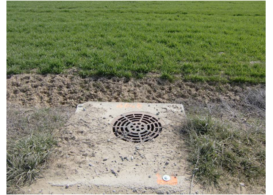
REGISTRO CONDUCCIÓN DE ABASTECIMIENTOS PARALELA AL CAMINO DEL CARRASCAL