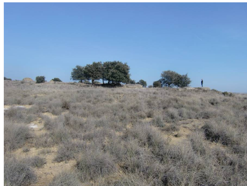
ZONA DE PASO DE LA VARIANTE EN EL ENTORNO DEL PK 8+900. AFECCIÓN A CANASCAS.