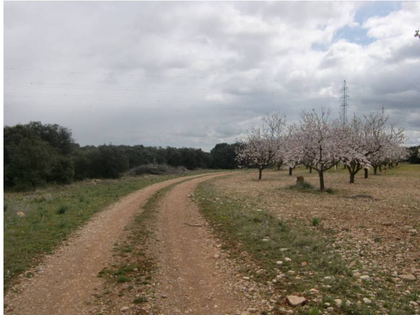
VISTA CAMINO CRUZADO EN EL ENTORNO DEL PK 14+710. REPOSICIÓN MEDIANTE PASO INFERIOR.