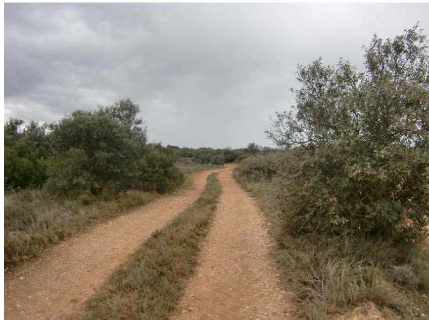
VISTA CABAÑERA REAL, PASADO EL CRUCE DE LA VARIANTE, HACIA EL NORTE.