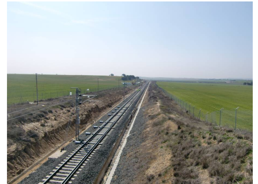
VISTA HACIA EL SUR, DESDE EL P. S. DEL CAMINO DE CUARTE A TABERNAS SOBRE LA LÍNEA FERROVIARIA