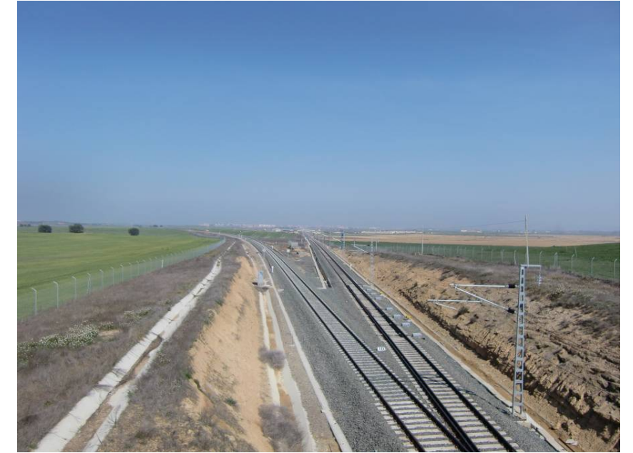
VISTA ZONA DE CRUCE LÍNEAS FERROVIARIAS