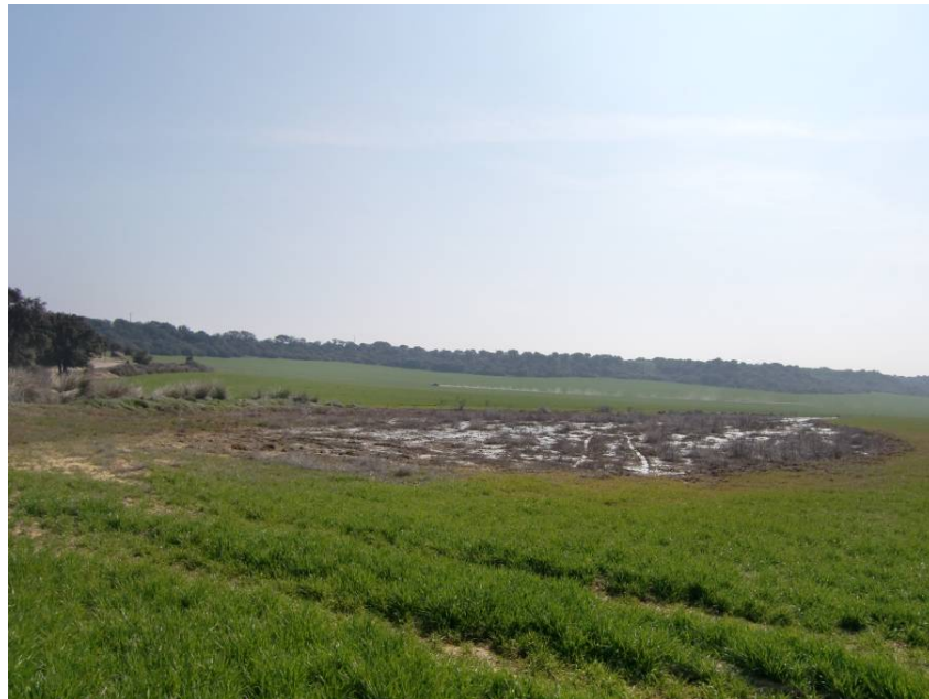
VISTA TRAMO ENTRE PPKK 2+600 A 2+ 900