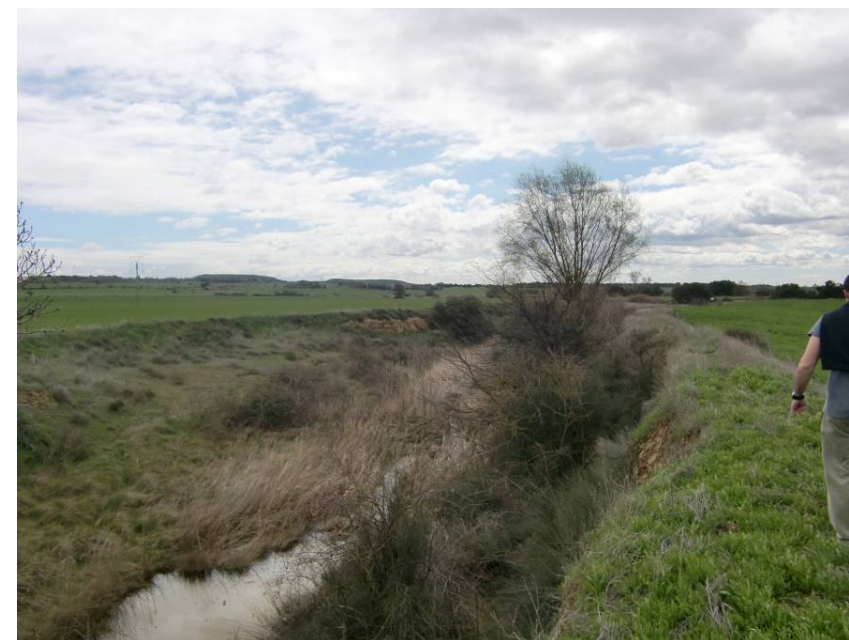
RIO BOTELLA VISTA HACIA AGUAS ABAJO