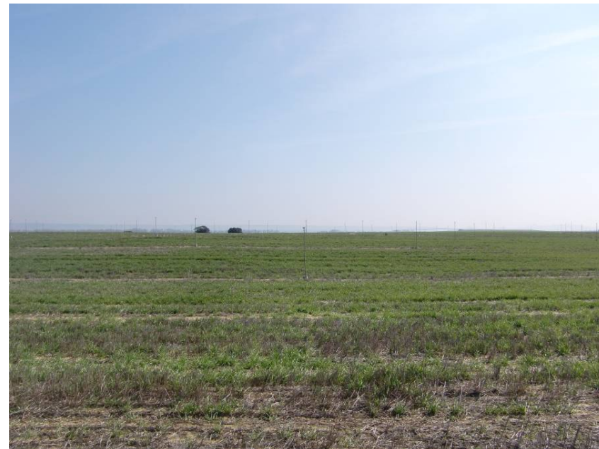
VISTA HACIA LLEIDA DESDE ENTORNO DEL PK 4+260.