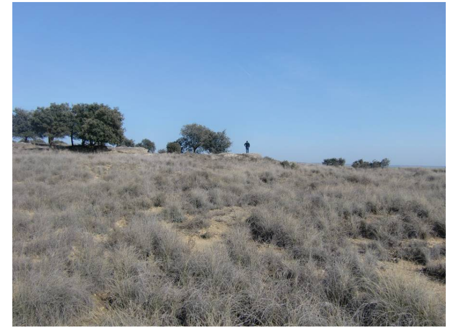
ZONA DE PASO DE LA VARIANTE EN EL ENTORNO DEL PK 8+900. AFECCIÓN A CANASCAS.