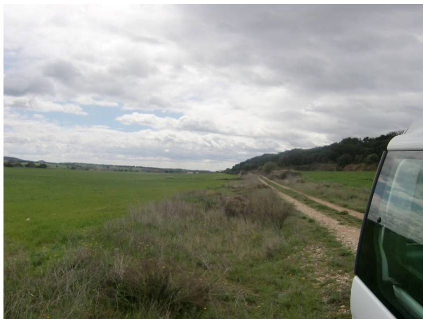
CAMINO DE LA RAMBLA. ZONA DE PASO DE LA VARIANTE. ENTORNO DE LOS PPKS 16+500 A 16+600. VISTA DESDE MARGEN IZQUIERDA.