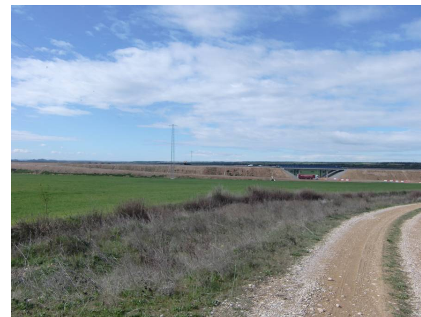
ZONA DE PASO DEL RAMAL DE LLEIDA- GLORIETA DE LA A – 22 ( EJE 101)