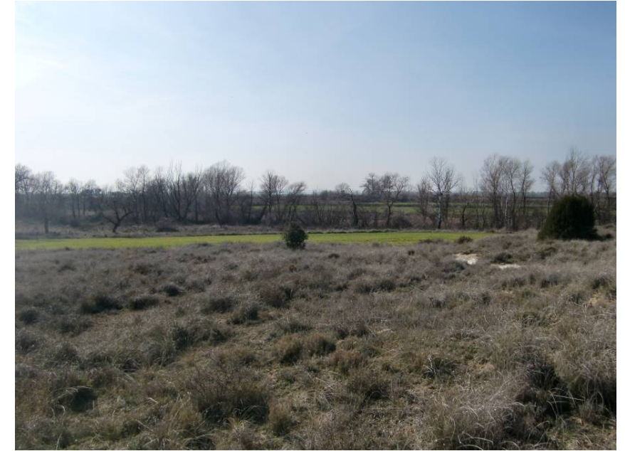
ZONA DE CRUCE DEL RÍO FLUMEN. VISTA SENTIDO ZARAGOZA, DESDE MARGEN DERECHA DEL RÍO.