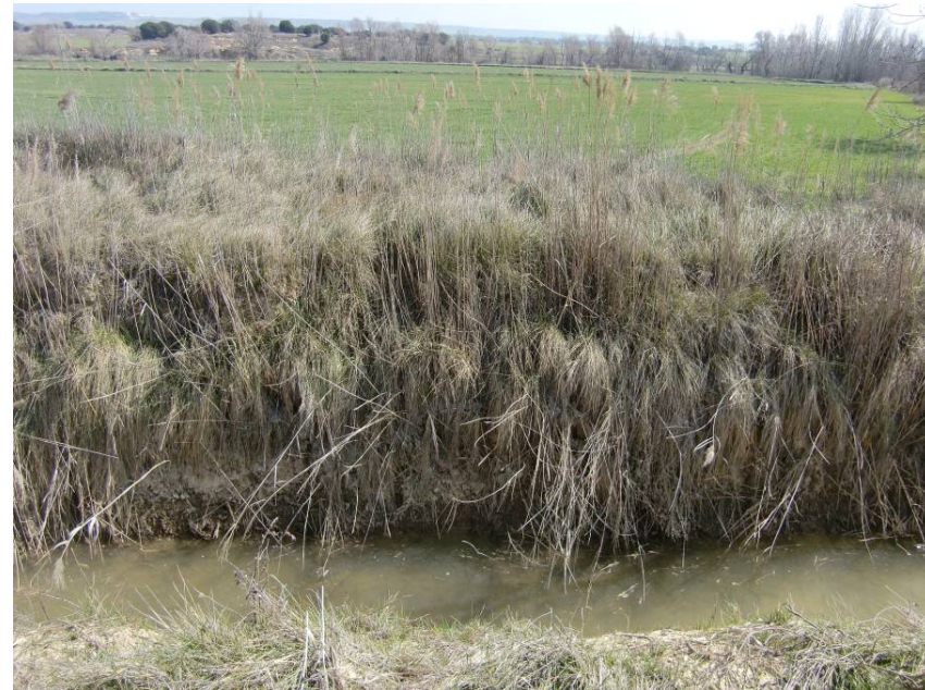
VISTA LLANURA DE INUNDACIÓN DEL RÍO FLUMEN AL OTRO LADO DE LA ACEQUIA MADRE. VISTA DE LA ACEQUIA EN PRIMER PLANO