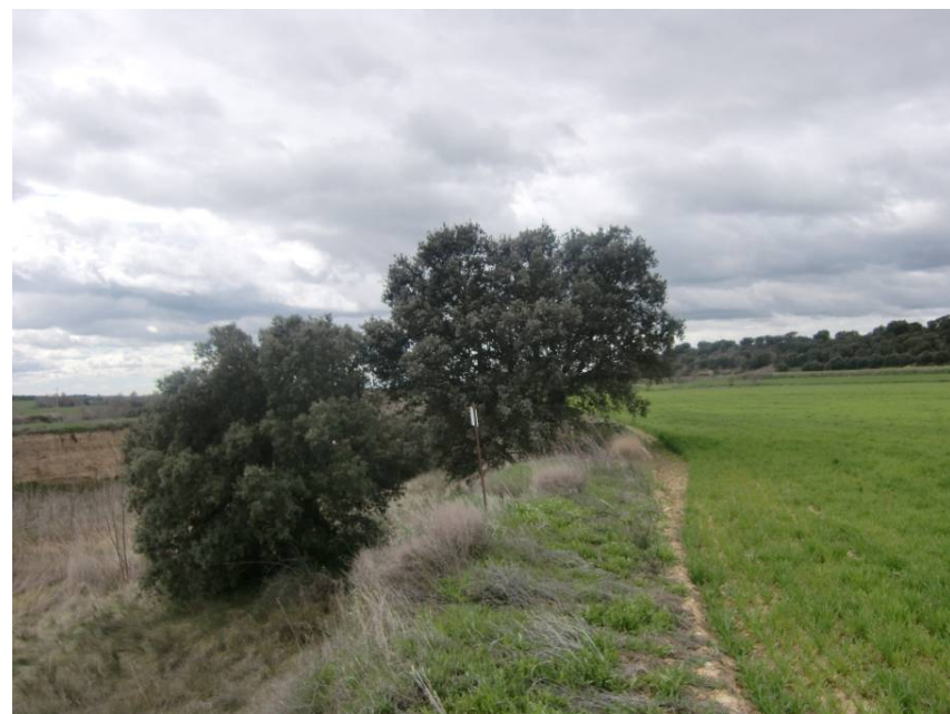
ENCINAS AFECTADAS EN EL CRUCE DEL RÍO BOTELLA