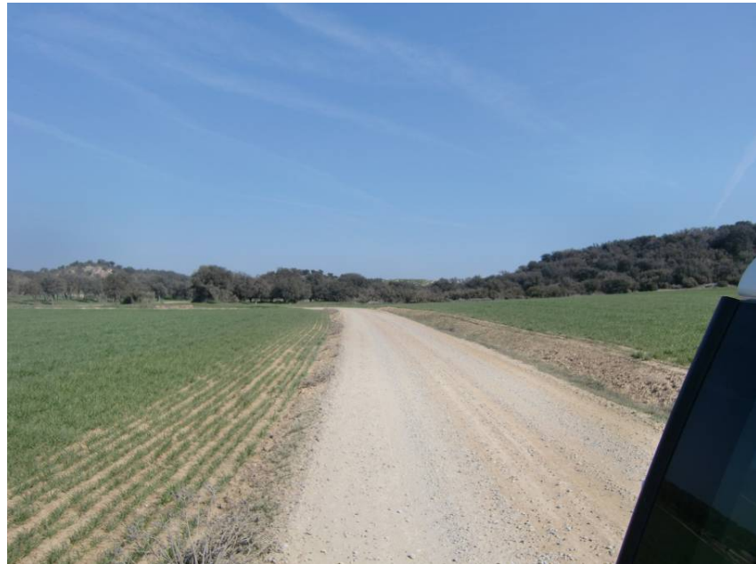
CAMINO DEL CARRASCAL PASADO EL CRUCE DE LA VARIANTE (DESDE MARGEN DERECHA)