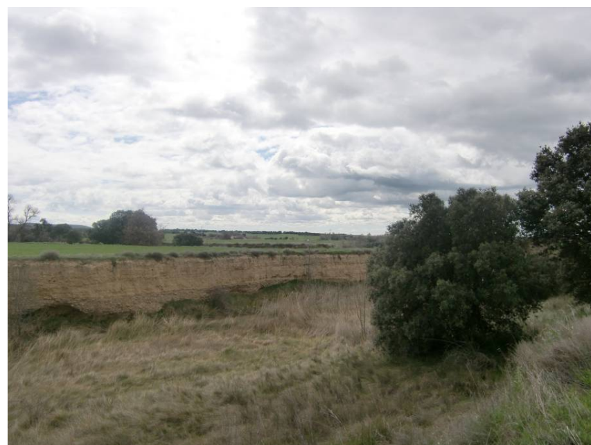
ZONA CRUCE RÍO BOTELLA