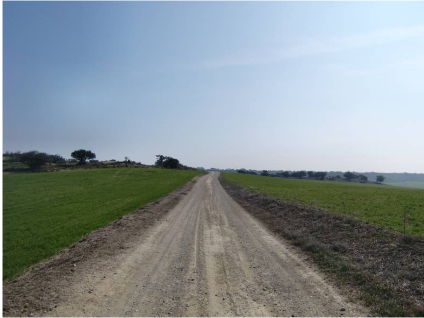
CAMINO DE S. JUAN ALTO