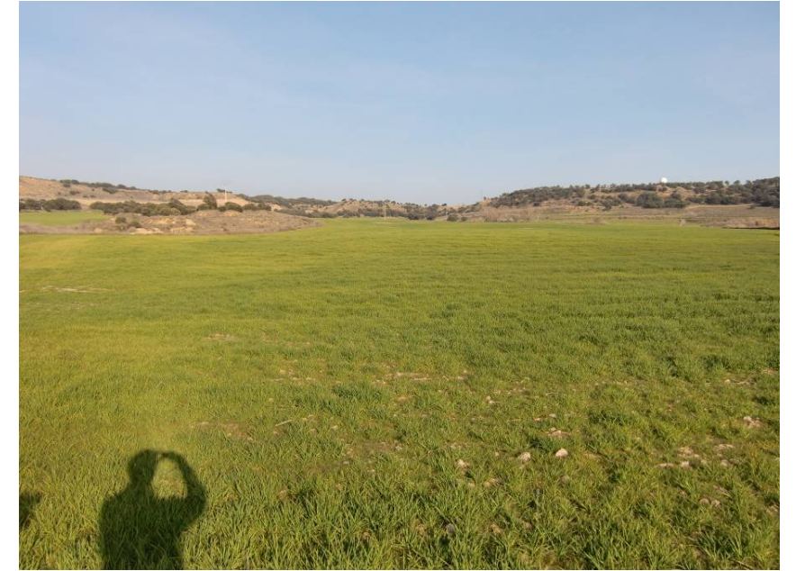
VISTA EN SENTIDO LLEIDA. ENTORNO DEL PK. 12+760