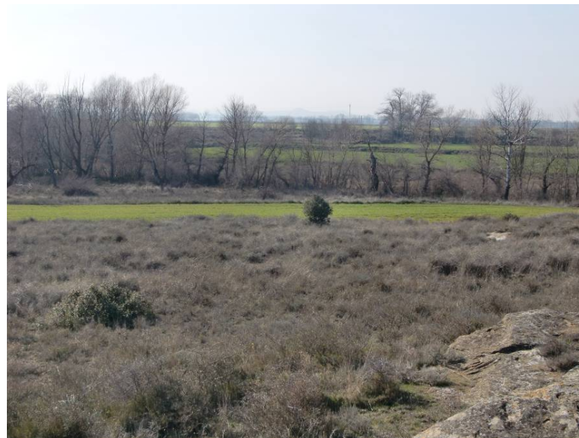
CRUCE RÍO FLUMEN. VISTA SENTIDO ZARAGOZA, DESDE MARGEN DERECHA DEL RÍO.