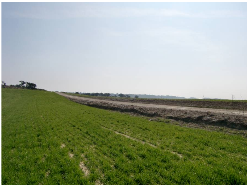
CAMINO DE S. JUAN ALTO