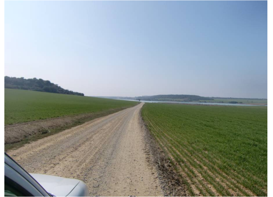
CAMINO DE LAS CANAS CAL