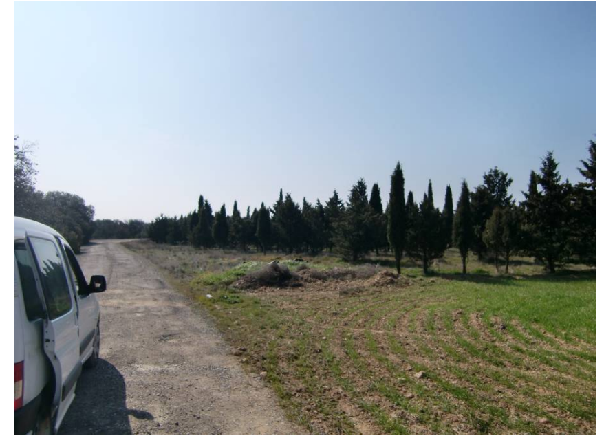
ZONA DE CRUCE DE LA VARIANTE. ENTORNO DEL PK 3+600. REPOSICIÓN CON P.S. (TRAMO EN DESMONTE)