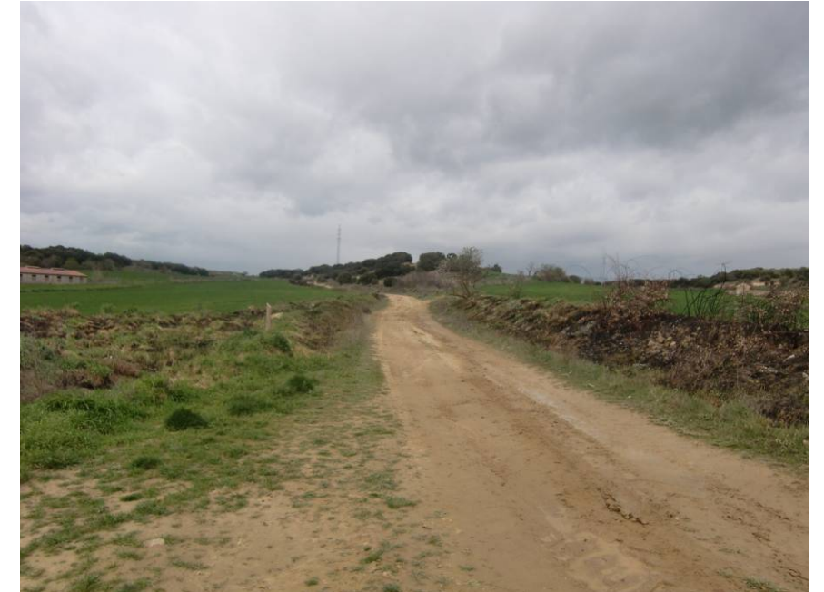
VISTA CAMINO A OLA HACIA EL NORTE