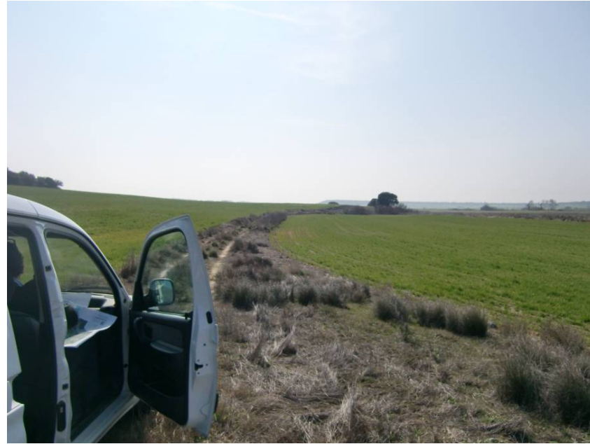
CAMINO DE VALDABRA. VISTA SENTIDO LLEIDA