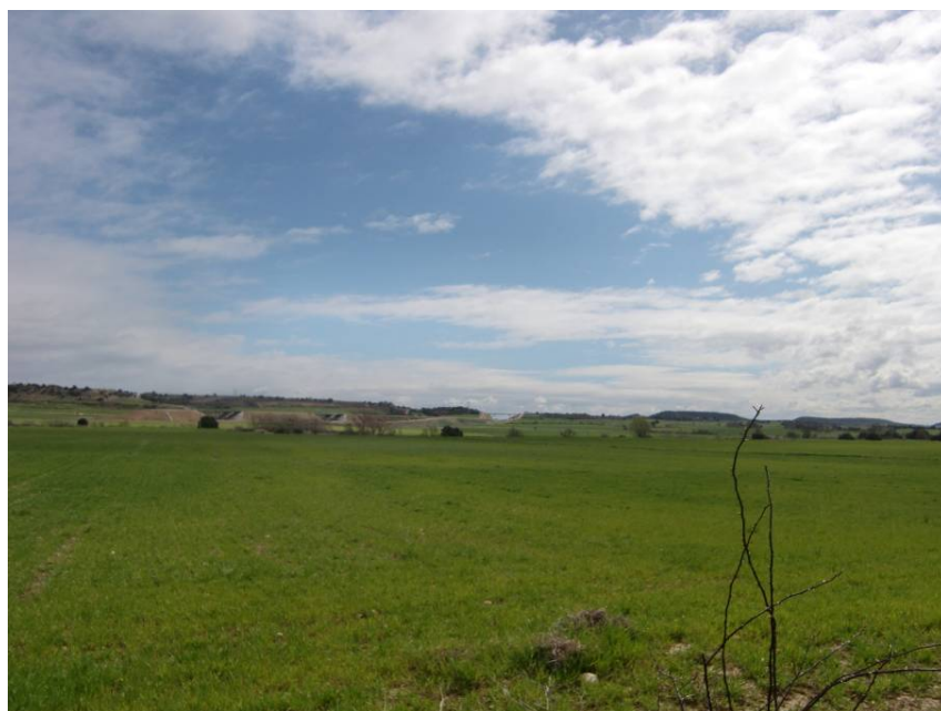
VISTA ZONA DE CONEXIÓN CON LA AUTOVÍA A - 22. ENLACE DE SIÉTAMO