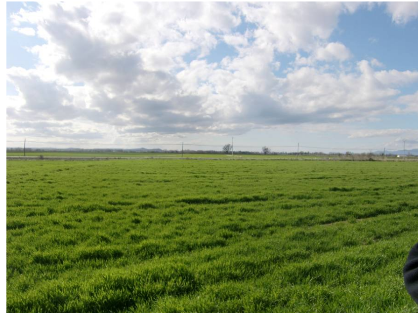
VISTA SENTIDO ZARAGOZA. ENTORNO DEL PK 8+140.