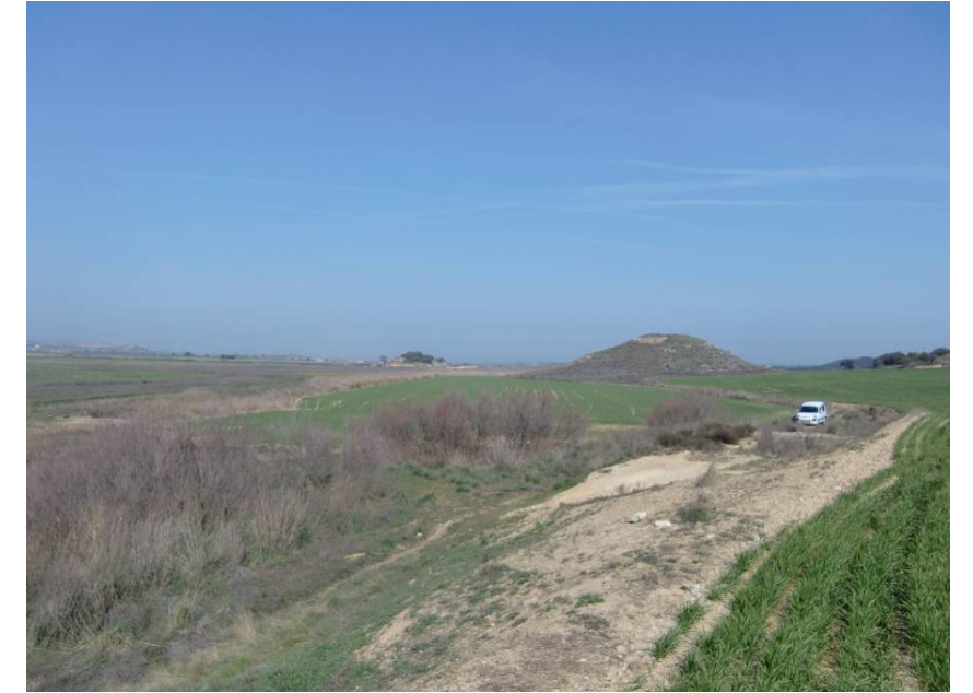
VISTA TRAMO ENTRE PPKK 1+ 300 – 1+500. MARGEN IZQUIERDA.