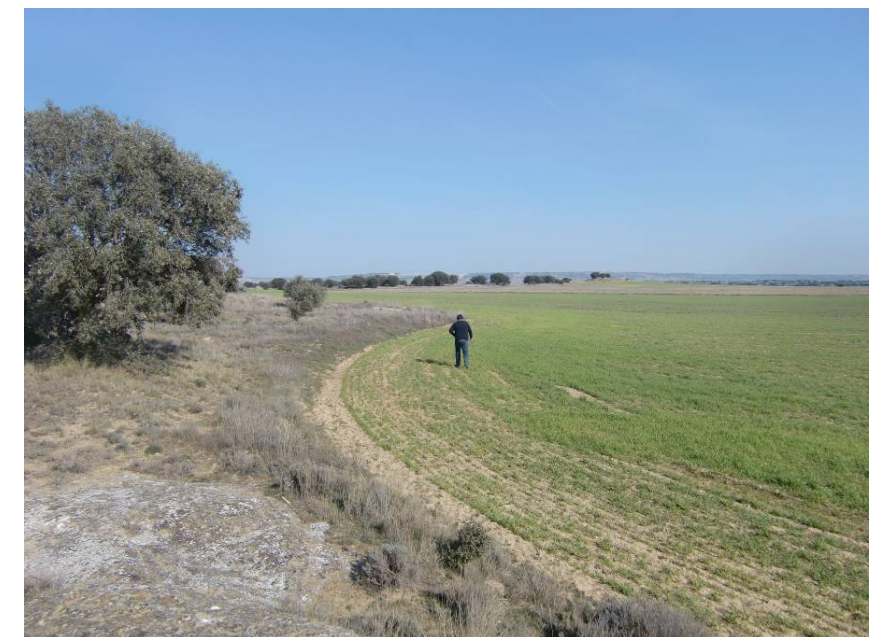
ZONA DE PASO DE LA VARIANTE. ENTORNO DE LOS PPKS 9+700 A 9+900. VISTA DESDE MARGEN IZQUIERDA, SENTIDO LLEIDA.