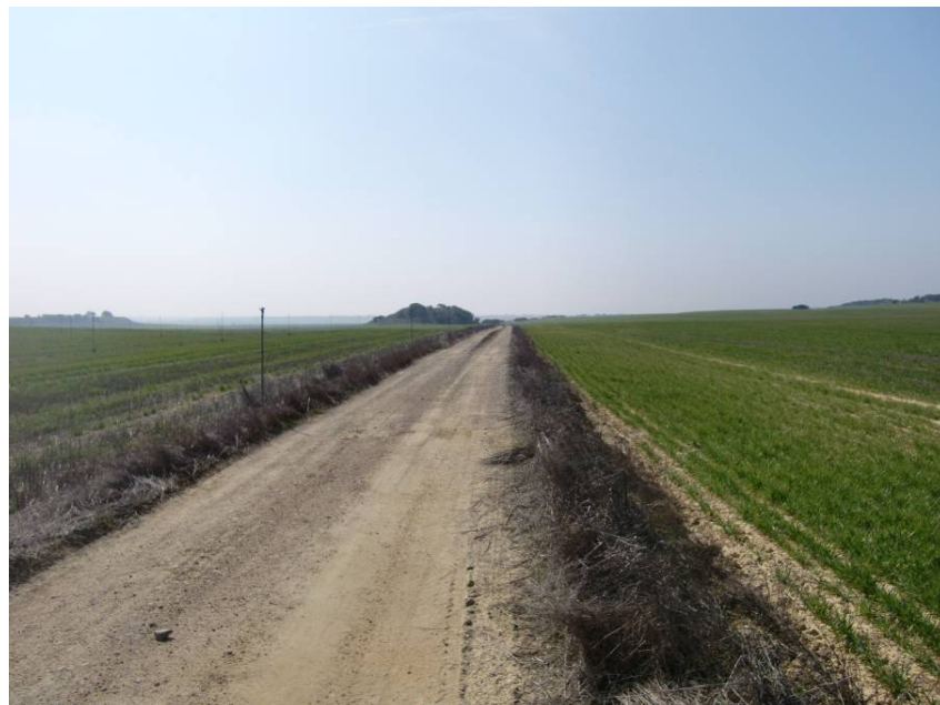
CAMINO DE CUARTE A TABERNAS. VISTA ZONA DE CRUCE CON LA VARIANTE (REPOSICIÓN CON P. I) .