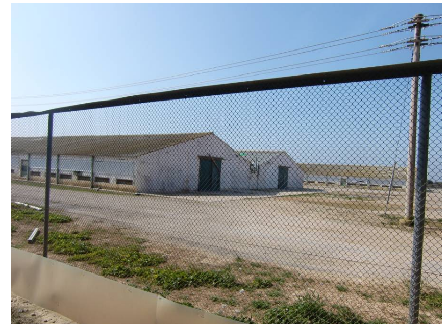
VISTA DE LA SEGUNDA DE LAS GRANJAS NO AFECTADA POR EL TRAZADO