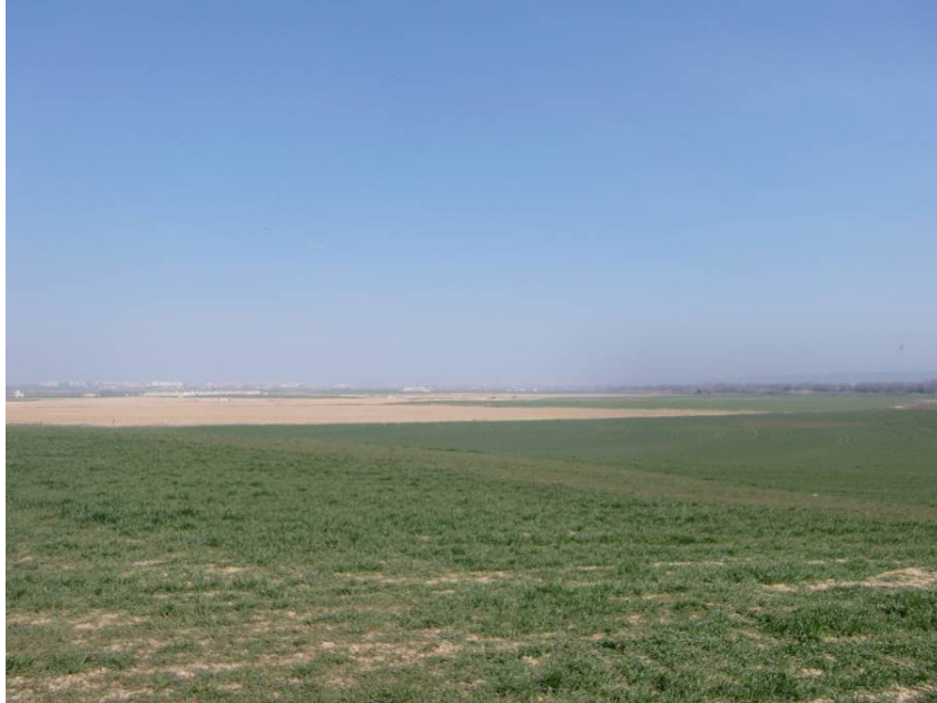
VISTA ZONA DE PASO DE LA VARIANTE. TRAMO ENTRE PPKK 4+900 A 5+300. DESDE MARGEN DERECHA