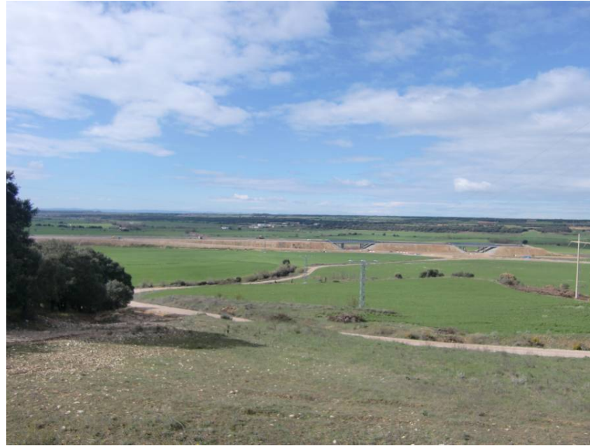
VISTA TRAMO FINAL DE LA A – 22 DONDE SE UBICARÁ LA CONEXIÓN CON ESTA AUTOVÍA (ENLACE SIÉTAMO).