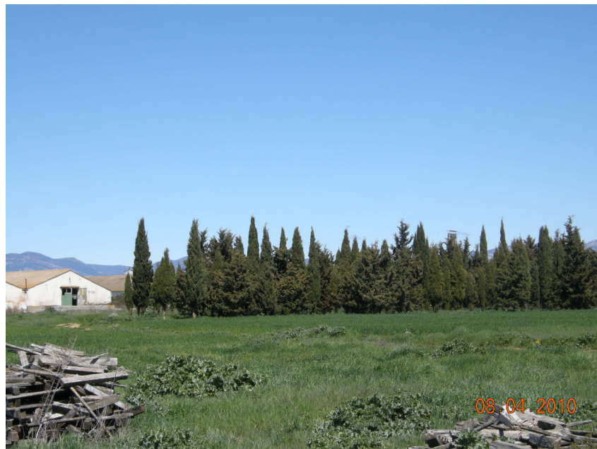
VISTA DE LAS GRANJAS AFECTADAS EN EL PK 3+400, ACTUALMENTE EN DESUSO