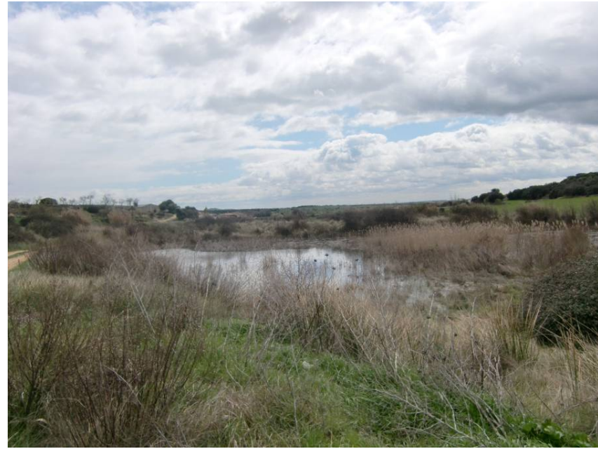
VISTA ZONA DEPRIMIDA CON ACUMULACIÓN DE AGUA. EL PROYECTO CONTEMPLA EL RELLENO DE ESTA ZONA Y LA REPOSICIÓN DE LA BALSA.