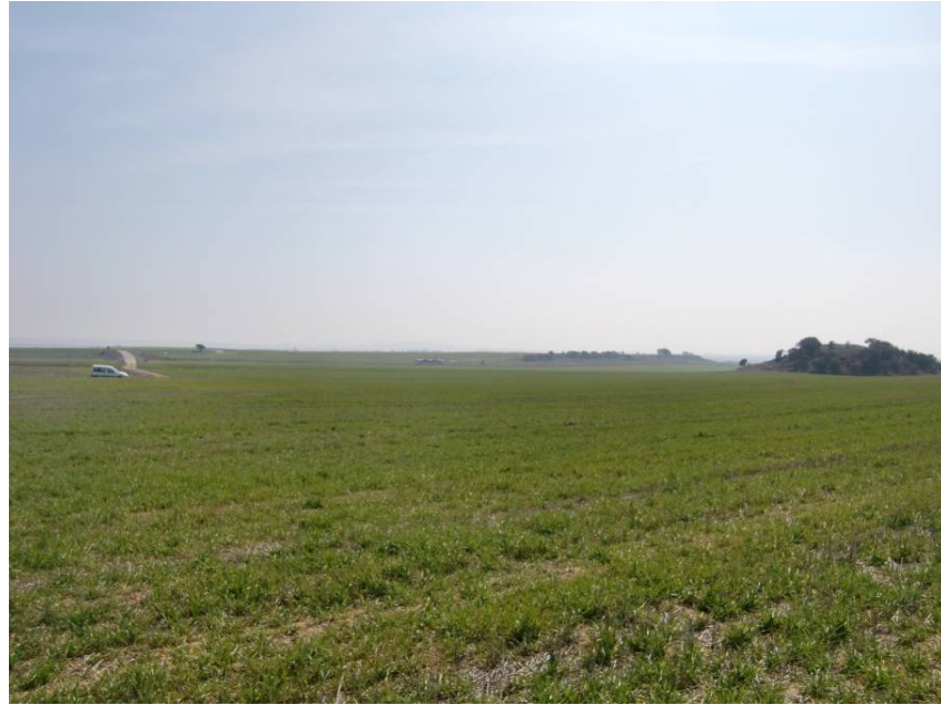
VISTA DESDE EL CAMINO DE CUARTE A TABERNAS DEL TRAMO ENTRE PPKK 4+300 A 4+500, DESDE MARGEN IZQUIERDA.