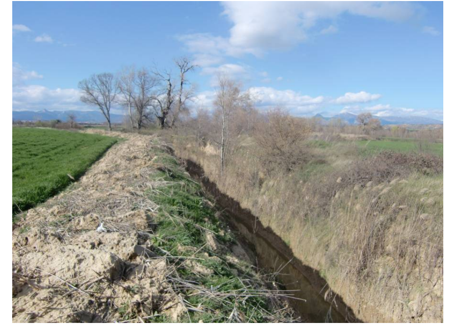
ACEQUIA MADRE EN EL ENTORNO DEL CRUCE CON LA VARIANTE.