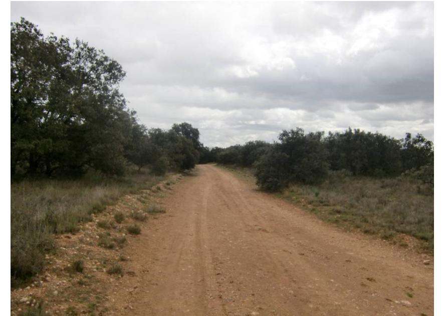
CABAÑERA REAL. VISTA HACIA EL SUR, ANTES DEL CRUCE DE LA FUTURA VARIANTE