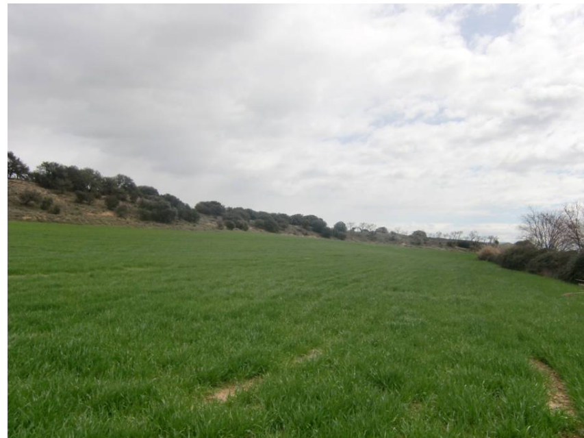
ZONA DE PASO DE LA VARIANTE. ENTORNO DE LOS PPKS 16+160 A 16+200