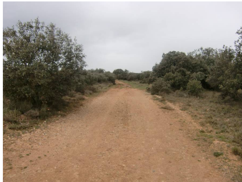
VISTA DE LA CABAÑERA REAL EN EL ENTORNO DEL CRUCE CON LA VARIANTE.