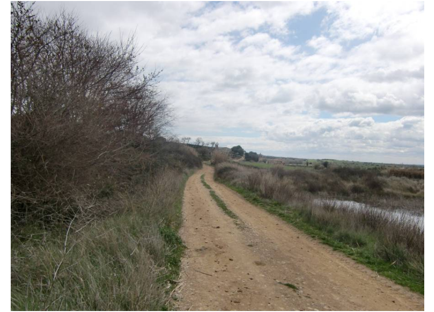
CAMINO A OLA Y BALSA A RELLENAR Y REPONER