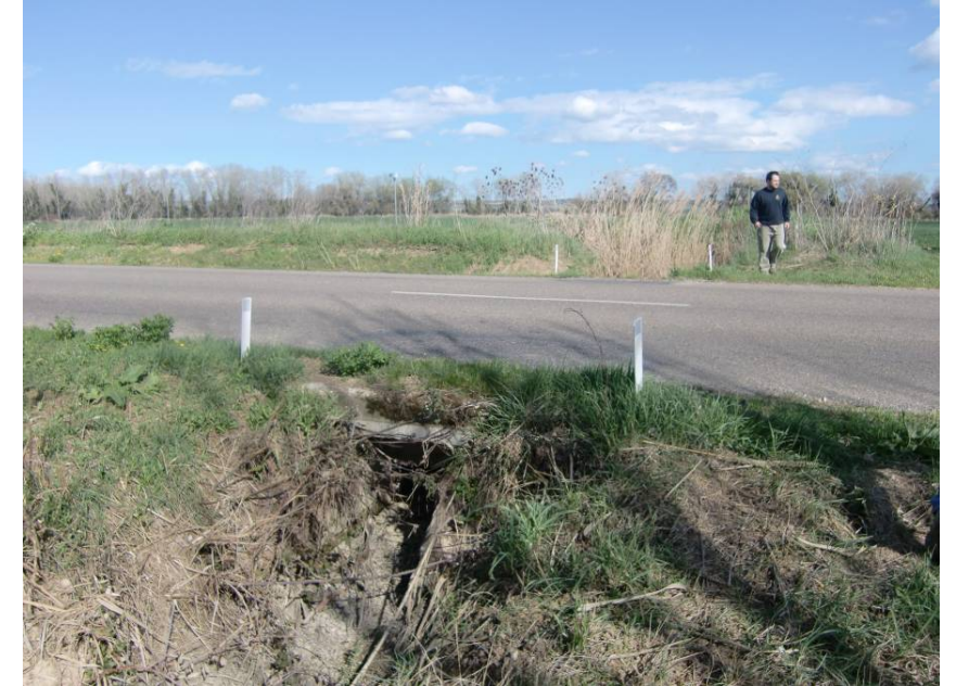
VISTA CRUCE DE LA ACEQUIA BAJO LA A-1212. ESTE ERA EL ENTORNO EN EL QUE CRUZABA LA VARIANTE EN EL TRAZADO AJUSTADO INICIALMENTE EN FASE 1.