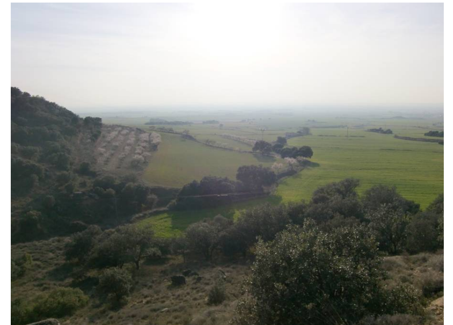
VISTA EN SENTIDO ZARAGOZA. IMAGEN TOMADA DESDE LA CARRETERA A 1219. ENTORNO DEL ENLACE AEROPUERTO.