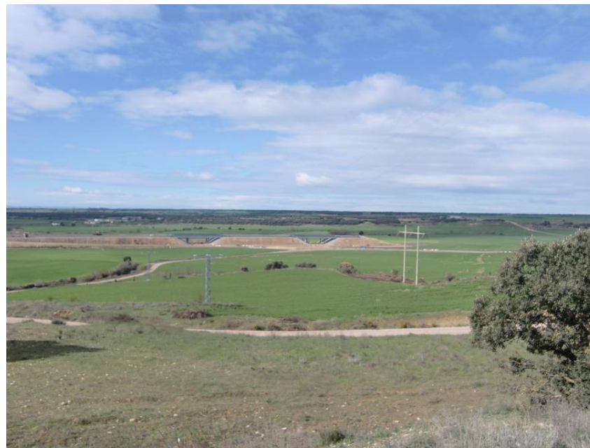
VISTA TRAMO FINAL DE LA A – 22 DONDE SE UBICARÁ LA CONEXIÓN CON ESTA AUTOVÍA (ENLACE SIÉTAMO).