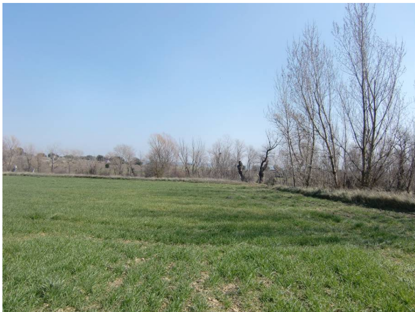
VISTA SENTIDO LLEIDA. ENTORNO DEL PK 8+260.