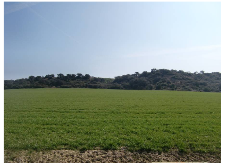
VISTA SENTIDO LLEIDA DESDE PK 2+ 960