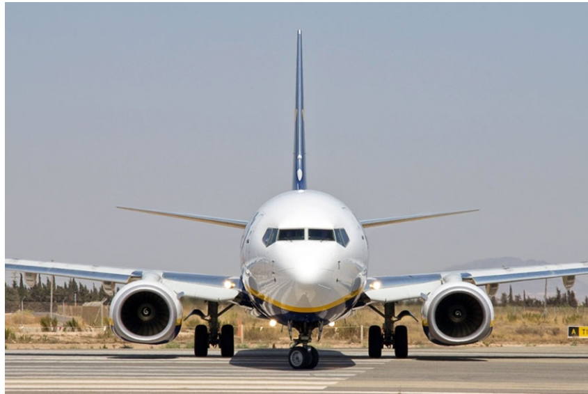
Figura 1. Fotografía de la aeronave 6

CFM 56-7B26. La aeronave tenía certificado de matrícula y de aeronavegabilidad válidos y en vigor. Asimismo contaba con el correspondiente seguro y certificado de limitación de ruido.