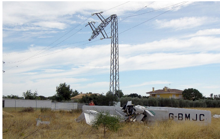
Figura 1. Estado de la aeronave y el tendido eléctrico tras el impacto

Ninguno de los cables fue cortado por el impacto del avión contra el tendido; el cable superior de la línea, o de masa, quedó deshilachado.