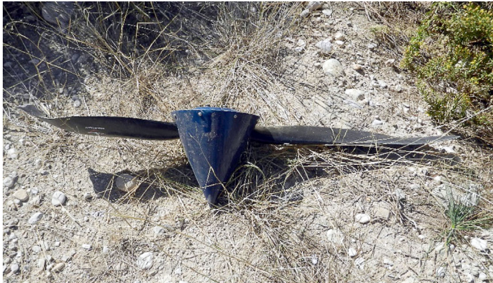
Figura 4. Hélice desprendida de la aeronave en el impacto

El examen de los restos permitió apreciar que el estado general y de mantenimiento de los elementos y sistemas de la aeronave era bueno: no se apreciaron signos de corrosión relevante, el estado de los cableados eléctricos era bueno tanto en motor como en la célula, la instrumentación era legible y los cables de control y mando tenían buen aspecto sin corrosión y sin rozaduras.