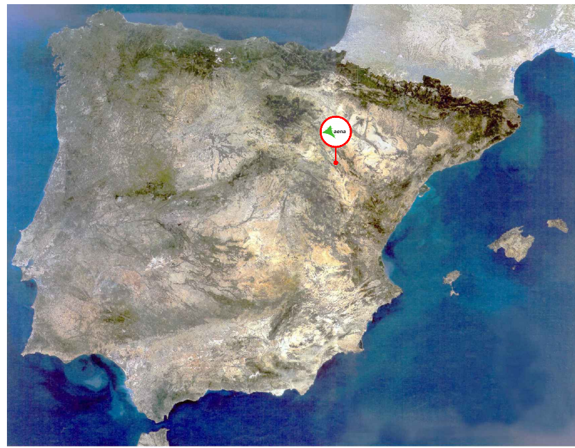
Situación. Marco Nacional