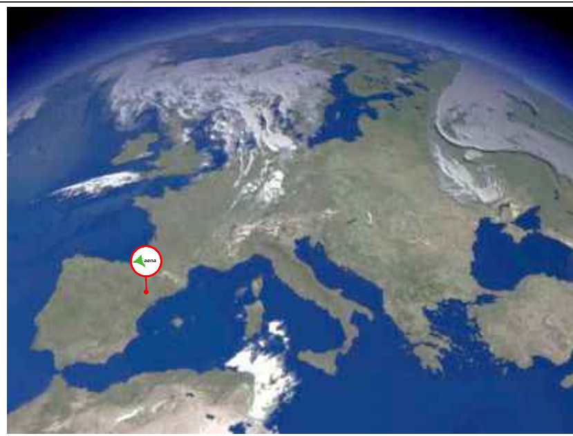
Situación. Marco Europeo