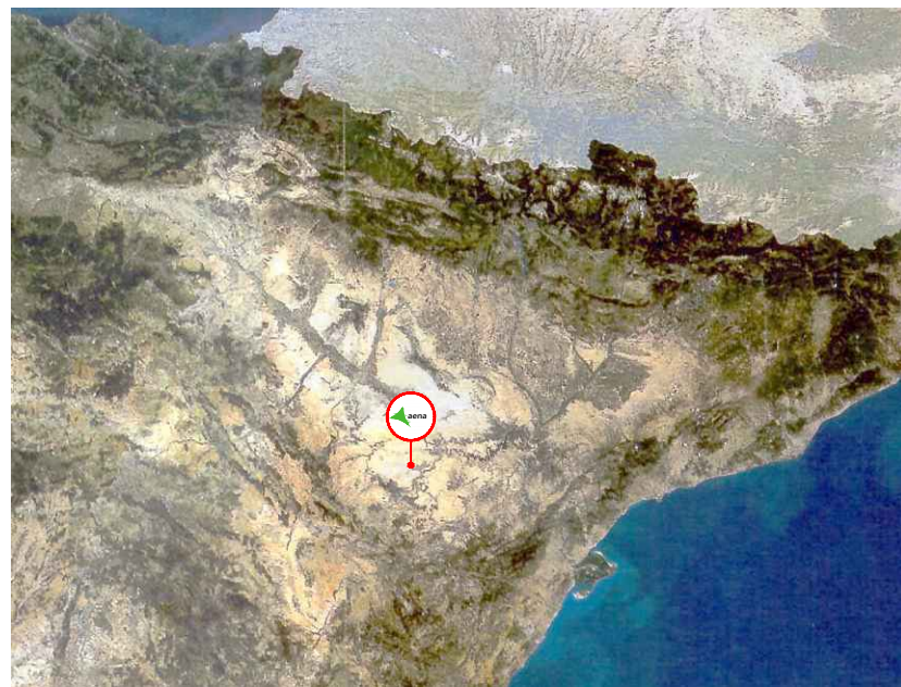
Situación. Marco Autonómico