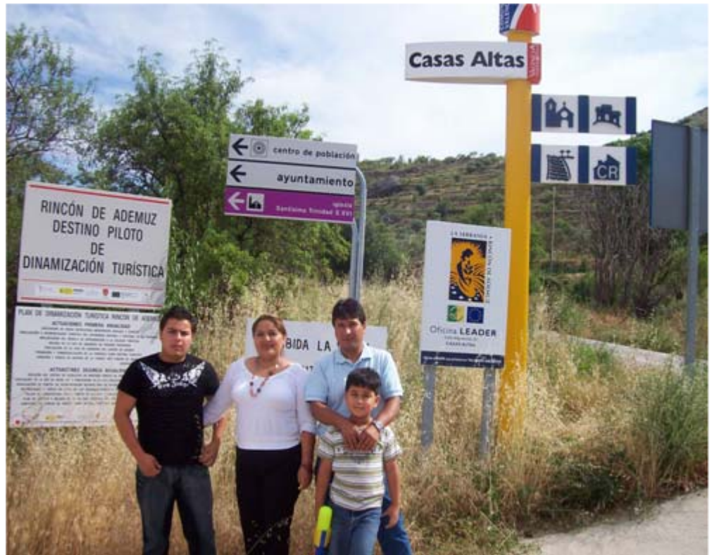
Imágenes de Familias y Pueblos participantes en el proyecto, los protagonistas del proyecto Nuevos Senderos.