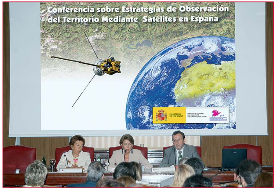
La Ministra de Fomento, junto a la Subsecretaria de Fomento y el Secretario General para el Territorio y la Biodiversidad del Ministerio de Medio Ambiente en el acto de apertura de la conferencia.

La apertura de la Conferencia corrió a cargo de Doña Magdalena Álvarez, Ministra de Fomento, quien resaltó la evidencia de su importancia, tanto a la vista de su objeto como por el destino de la misma (Directores Generales de la Administración General del Estado y de las Comunidades Autónomas), y el protagonismo hoy día de los satélites