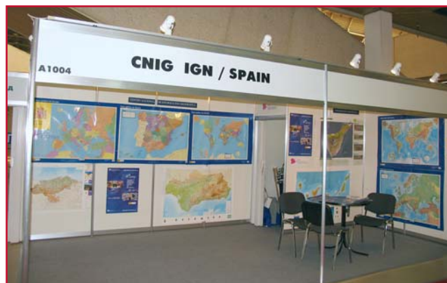
Stand en el que el IGN presentó diversos trabajos de cartografía en la XXIII Conferencia Cartográfica en Moscú.