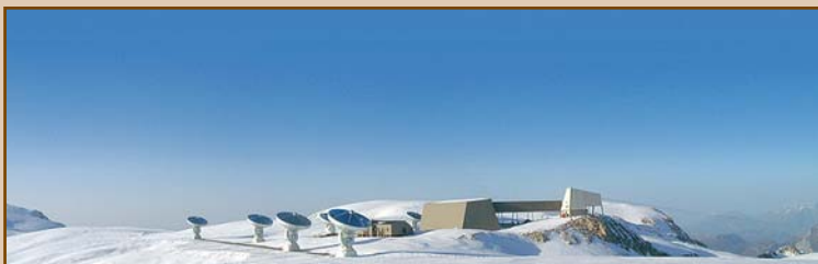
El interferómetro del IRAM en el Plateau de Bure (Alpes Franceses).

El IGN que –junto con el CNRS francés y la Sociedad Max-Planck alemana– es miembro de pleno derecho del IRAM, ha participado muy activamente en las mejoras del interferómetro de Bure, en particular mediante la inclusión en los nuevos receptores de amplificadores diseñados en los laboratorios del Observatorio Astronómico Nacional (OAN) en Yeves. Los retornos científico-técnicos para nuestro país están siendo considerables. Desde el punto de vista tecnológico cabe destacar la participación de empresas españolas en la construcción de los receptores. Desde el punto de vista meramente científico, destaca la notable participación de nuestros astrónomos en la obtención de resultados: de los 15 artículos del número especial de «Astronomy and Astrophysics», 6 cuentan con participación (5 de ellos con el liderazgo) de astrónomos del OAN (IGN).