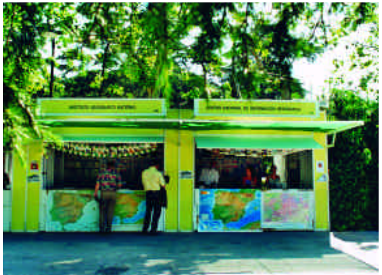
Casetas del IGN y del CNIG en la Feria del Libro de Madrid.

La instalación del CNIG tuvo 3.500 clientes, aunque el número de