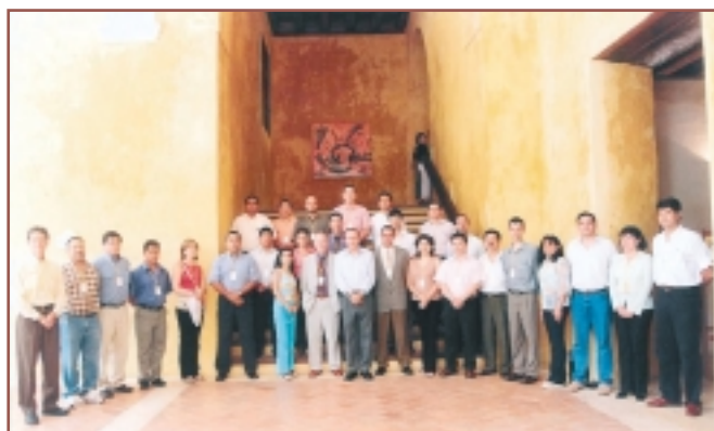
VII Curso Digital de Cartografía Digital y Sistemas de Información Geográfica.

evaluación del Curso por los participantes ha sido la siguiente: