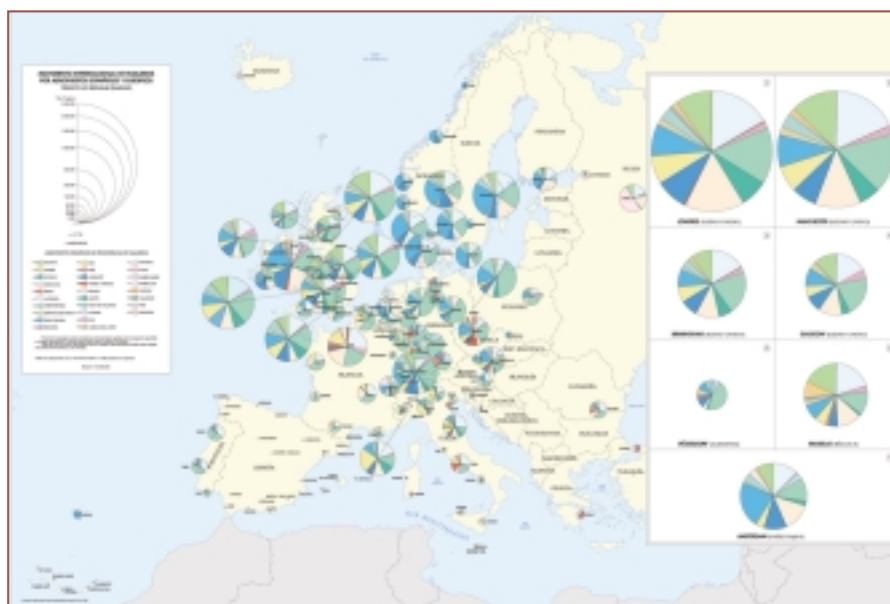
Transporte aéreo. Representación del tráfico no regular de pasajeros con Europa.

2003 para el Tomo III ( Transporte por carretera, Transporte por ferrocarril, Transporte aéreo, Transporte marítimo, Transporte urbano, Comunicaciones, Actividades empresariales, Comercio interior, Comercio exterior, y Finanzas y Hacienda ). ■