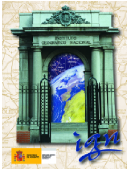
Portada del folleto elaborado para los colegios.

El programa de la visita para los alumnos de los colegios e institutos versa fundamentalmente sobre Cartografía y técnicas de producción cartográfica, incluye una presentación en vídeo sobre todas las actividades que se llevan a cabo en el IGN, y comprende una visita a las distintas unidades implicadas en el proceso cartográfico. Centrada la visita en la confección del Mapa Topográfico Nacional a escala 1/25.000, el personal técnico que acompaña a los estudiantes les explica paso a paso el proceso de formación del mapa, desde el vuelo a la reproducción, pasando por Fotogrametría, visualización de los aparatos restituidores, fotografía cartográfica, pasado de planchas, máqui-