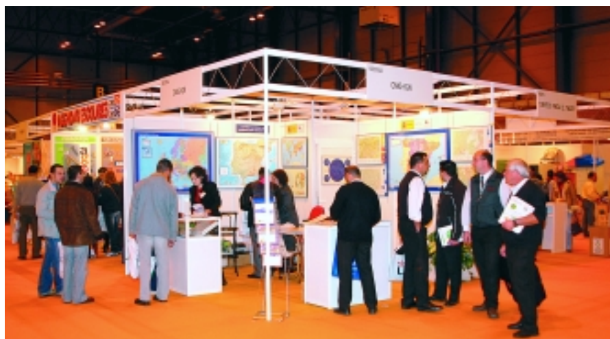
Stand del CNIG en la feria INTERDIDAC.

En esta misma línea de actividad se enmarca la realización del DVD El mundo del mapa como instrumento de apoyo a las presentaciones que se realizan en las distintas sedes del Instituto, colegios, institutos y centros culturales. ■